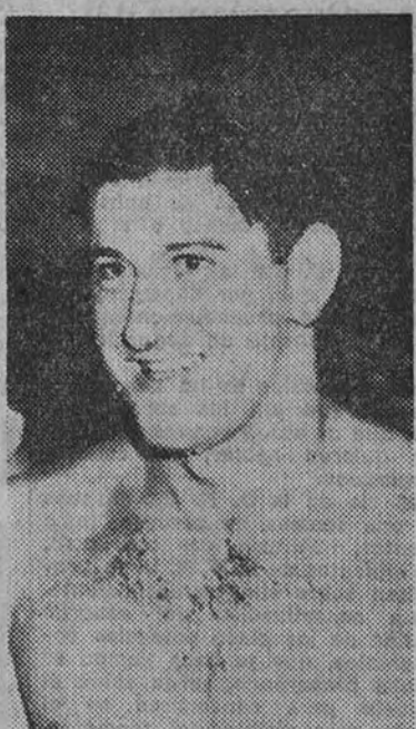
El "recordman" del mundo, Alex Jany, actuará en la piscina del Club Natación Barcelona en los primeros días de este mes, formando parte del equipo T. O. E. C. de Toulouse.