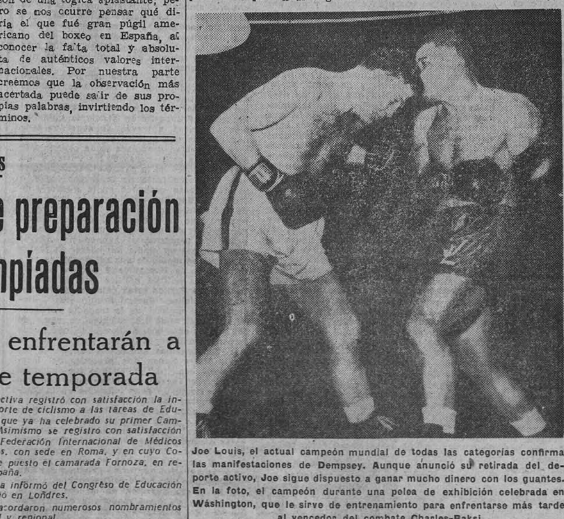
Joe Louis, el actual campeón mundial de todas las categorías confirma las manifestaciones de Dempsey. Aunque anunció su retirada del deporte activo, Joe sigue dispuesto a ganar mucho dinero con los guantes. En la foto, el campeón durante una pelea de exhibición celebrada en Washington, que le sirvió de entrenamiento para enfrentarse más tarde al vencedor del combate Charles-Baksi.

Jack Dempsey, el ex campeón mundial de todas las categorías, considerado como el mejor púgil de todos los tiempos, dijo en unas manifestaciones a un crítico francés, que el boxeo de América está en plena decadencia. Alega en sus declaraciones que el principal motivo de este descenso, se debe al mercantilismo alcanzado por este deporte. Los boxeadores que ganan mucho dinero no se empujan a fondo en los combates, con el fin de conservarse en perfectas condiciones físicas con miras a otras peleas que pueden aumentar su fortuna. Las observaciones de Dempsey son de una lógica espeluznante; pero no se nos ocurre pensar qué diría el que fué gran púgil americano del boxeo en España, al conocer la falta total y absoluta de auténticos valores internacionales. Por nuestra parte creemos que la observación más acertada puede salir de sus propias palabras, invirtiendo los términos.