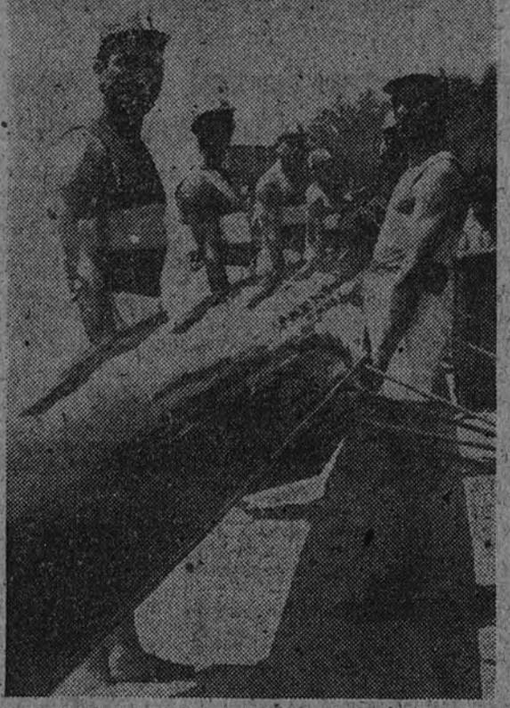
El "ocho" del Club Los Galitos de Aveiro, que representará a Portugal en el V Campeonato Ibérico de remo.

De todas formas, entre los federativos españoles existe cierto optimismo, pues consideran que la victoria de Ordoñez y tienen fundadas esperanzas en el magnífico momento por que atraviesa el cuatro de Ur Krolak.