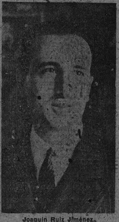
Joaquín Ruiz Jiménez.

En la Subsecretaría de Educación popular se ha facilitado la siguiente referencia de lo tratado en el Consejo de Ministros celebrado en el día de ayer bajo la presidencia de Su Excelencia el Jefe del Estado: ASUNTOS EXTERIORES. —Acuerdo de navegación aérea con los Países Bajos.