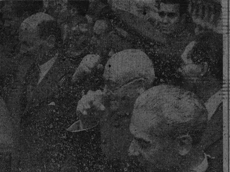
Mister Attlee, presidente del Gobierno inglés, acompañado de sus "amigos" españoles, en la época en que estos amigos desahuciaron el terror sobre España a las órdenes de Moscú. Mister Attlee, como un Dímforo cualquiera, clerica el puño comunista sobre un Madrid martirizado, lleno de chubas y de sangre.