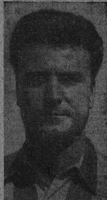
Valdiveiso vuelve a la línea media, donde formará pareja con Muga. El equipo, que contendrá el próximo domingo contra el Atlético de Madrid en el Estadio Metropolitano: Acuña, Fontalba, Ponte, García, Guimeráns, Carltos, Martín, Juanete, Fernández, Franco y Marquines. Como suplentes se desfilan: Lestón y Dieste. (Mencheta.)

"LA CORUÑA 7."—Después de los entrenamientos efectuados ayer y hoy, el entrenador del Deportivo, Andoanegui, ha designado el siguiente equipo: