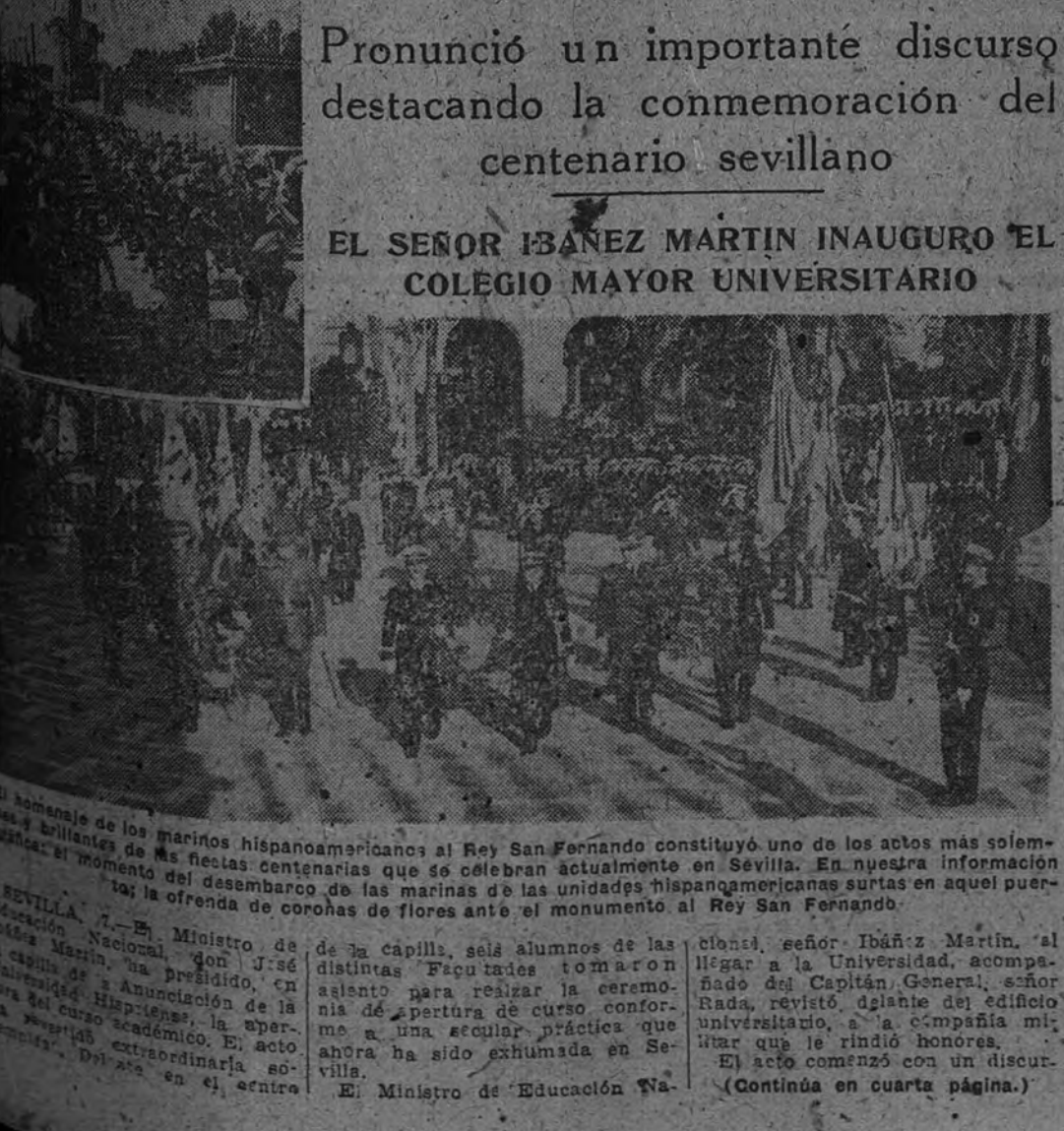
El momento del desembarco de las marinas de las unidades hispanoamericanas surtas en aquel puerto: la ofrenda de coronas de flores ante el monumento al Rey San Fernando.

EL MINISTRO DE ASUNTOS EXTERIORES HA ENCARGADO A NUESTRO MINISTRO EN LONDRES, DUQUE DE SAN LUCAR, LA PRESENTACION DE UNA NOTA DE PROTESTA CONTRA LAS APRECIACIONES HECHAS POR EL LLAMADO PORTAVOZ DEL FOREIGN OFFICE A PROPOSITO DEL SUPUESTO ACUERDO ENTRE SOCIALISTAS Y MONARQUICOS, QUE SE DICE COMUNICADO A LA EMBAJADA INGLESA EN PARIS.