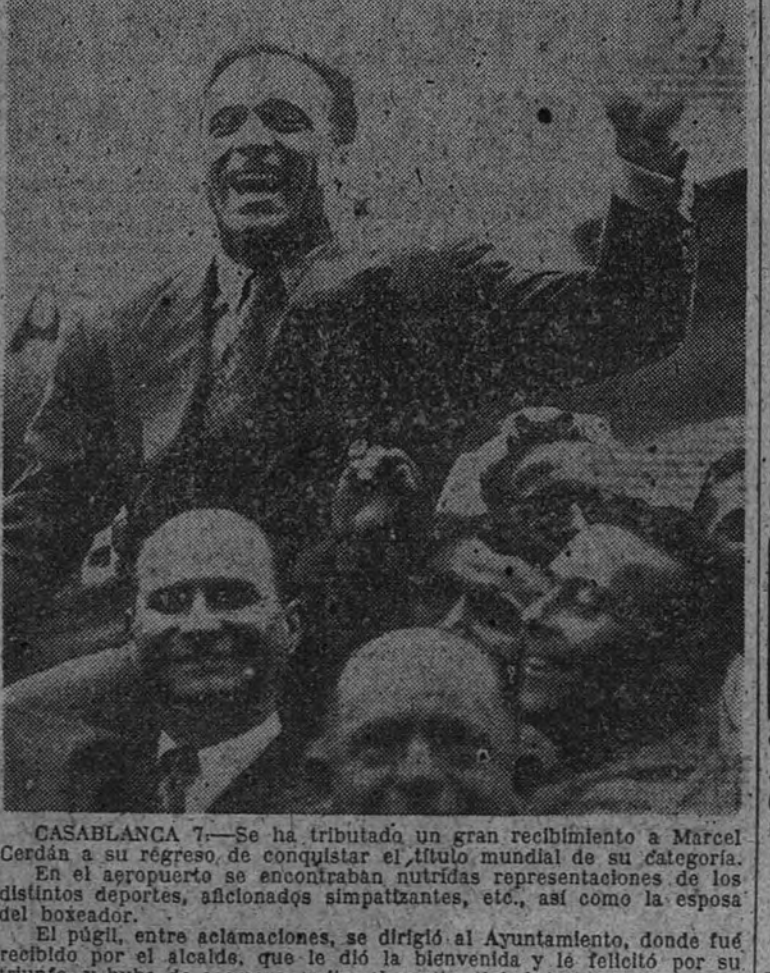
CASABLANCA 7.—Se ha tributado un gran recibimiento a Marcel Cerdán a su regreso de conquistar el título mundial de su categoría. En el aeropuerto se encontraban nutridas representaciones de los distintos deportes, aficionados simpáticos, etc., así como la esposa del boxeador.

El púgil, entre aclamaciones, se dirigió al Ayuntamiento, donde fué recibido por el alcalde, que le dió la bienvenida y le felicitó por su triunfo, y hubo de asomarse reiteradamente al balcón para corresponder a las aclamaciones de la multitud. (Mencheta.)