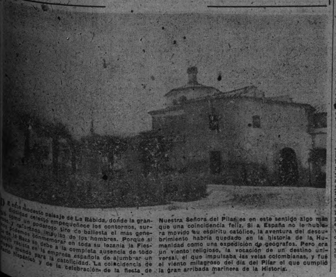
Nuestra Señora del Pilar es en este sentido algo más que una coincidencia feliz. Si a España no le hubiera movido su espíritu católico, la aventura del descubrimiento habría quedado en la historia de la Humanidad como una expedición de geógrafos. Pero era un viento religioso, la vocación de un destino universal, el que impulsaba las velas colombianas, y fue el viento milagroso del día del Pilar el que cumplió la gran arribada marinera de la Historia.