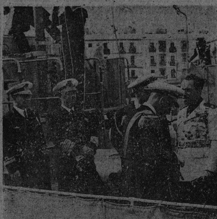
Su Excelencia el jefe del Estado a bordo de la lancha torpedera que le condujo a Cádiz

Después de la reunión el Ministerio de Obras Públicas emprendió el regreso a Madrid. (Cifra.)