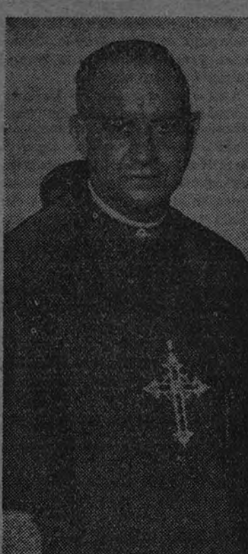
Dr. Eijo Garay, el "Obispo misionero", esforzado paladín de la Propagación de la Fe

Se han celebrado cinco cursillos para celadores de la Obra Misional, y en la actualidad está teniendo lugar el sexto, con un total de matriculados que pasa de las tres mil. Cursillos para universitarios se han celebrado seis, con un total de mil alumnos. Siete cursos para alumnos