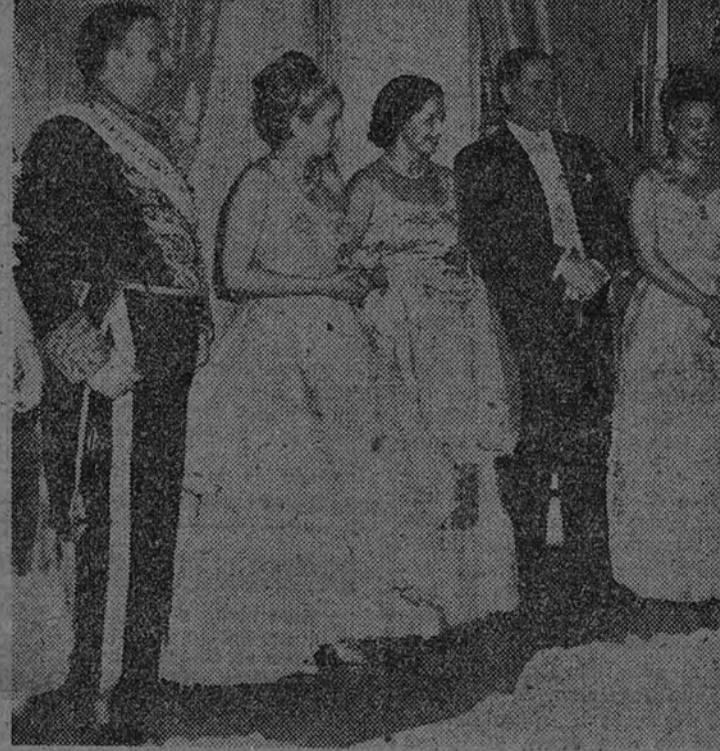
Nuestra primera fotografía recoge el instante en que el Presidente argentino recibe, con un estrecho abrazo, en la Casa del Gobierno al señor Martín Artajo. En la segunda foto aparecen el general Perón y el Ministro español, acompañados de sus respectivos esposos y de otras personalidades, durante un entreacto de la función de gala celebrada en el teatro Colón el día de la Raza.

Pero no es tanto la personalidad de Suárez la que mueve este comentario—implicaría un reposo y minusculidad aquí imposibles el estudio de su figura—, como el discurso que, con ocasión de su cuarto centenario, ha pronunciado en Granada nuestro camarada Raimundo Fernández Cuesta. Cuando se buscan las doctrinas jurídicas, no que defendiendo, pues la verdad no precisa defensores, pero sí que retiquen las más exigentes justificaciones de nuestra actual postura política—de la España que surge en 1898 como una rebelión santa contra la injusticia y la tiranía—, los escritos del padre Suárez surgen como fuente meridiana de una justificación, pura y absoluta, en siglos a muchas de nuestras razones. La gran democracia, verdadera y militante, que fue aquella España grande y poderosa del siglo XVI, aparece expresada en la doctrina de nuestros Juristas y teólogos, exigiendo una aplicación de tal