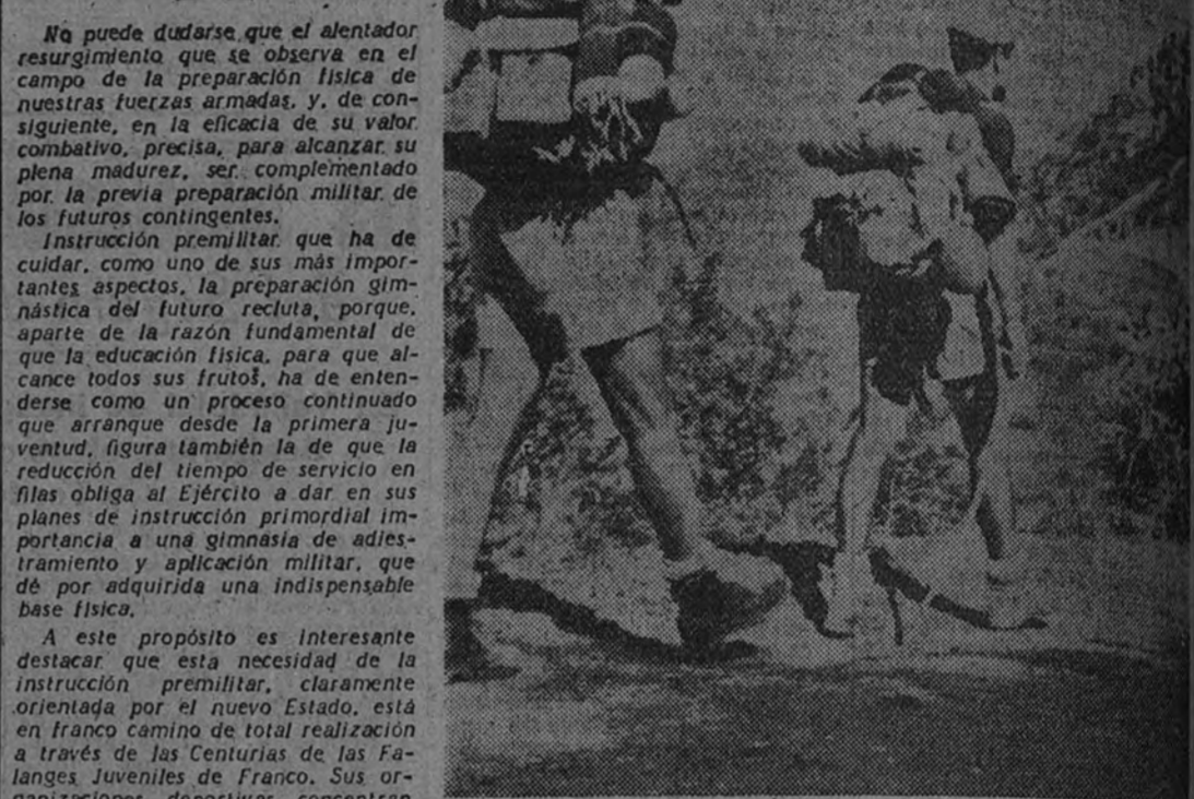
En estas marchas por etapas las Centurias de las Falanges de Franco van completando su preparación para una mañana plena de alegría y vigor

Las Centurias de las Falanges de Franco realizaron las marchas por etapas con el mayor entusiasmo, cubriendo sin novedad el plan fijado: 15.000 muchachos recorrieron 36.000 kilómetros. (De la Prensa diaria.)