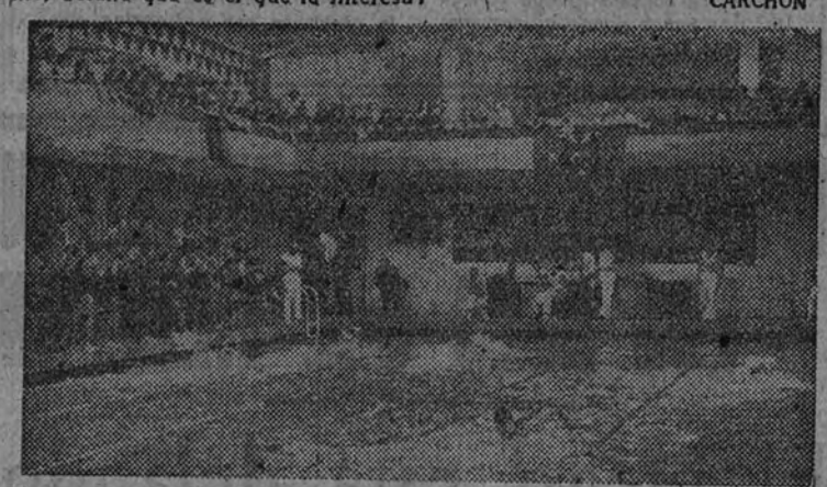
Un aspecto de la piscina de La Isla, donde el próximo sábado darán comienzo los Campeonatos nacionales de Educación y Descanso