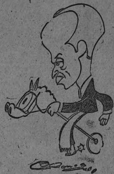
Ingenua, obra tan sólo con los productos del rejoneo.

—La cosa es casi noviciosa. Fue mi regala favorita, "Española", así que me dió la idea. Sí, sí, la "Española". Ella, tan valiente, gallarda y generosa, como su mismo nombre indica, inspira muchos de mis actos. ¿Cómo corresponder yo a su regala? ¿Entonces? ¿A qué? ¿Y repitiéndola una y otra vez la misma pregunta me vino al pensamiento la idea de construir una colonia que llevara el nombre de mi regala, la "Española".