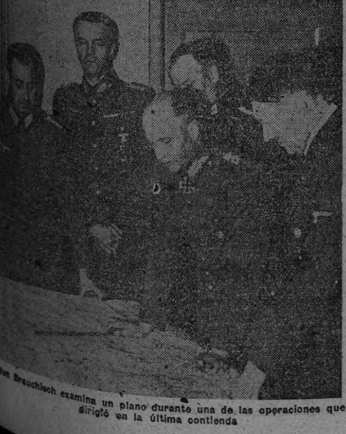
Von Brauchitsch examina un plano durante una de las operaciones que dirigió en la última contienda

Como oficial de Estado Mayor del decimosexto Ejército tomó parte en la primera guerra europea y se distinguió por su valor y sus conocimientos técnicos en la batalla de Verdún. En 1915 fue condecorado con la Cruz de Hierro de primera clase, y dos años después, a propuesta del general Ludendorff, recibió la Cruz de la Orden de Hohenzollern. Terminada la primera gran guerra, Von Brauchitsch, ya comandante, ingresó en la Reichwehr, y en el nuevo Ejército alemán mantuvo desde 1936 el grupo de Ejércitos de Leipzig, en el cual habían sido reunidas todas las unidades motorizadas de las fuerzas de tierra. Mandadas directamente por él, las tropas alemanas entraron en Austria, cuando el "Anchluss", en la región de los sudetes y en Bohemia y Moravia. La "guerra relámpago" de Polonia y la campaña rápida de Noruega, del Oeste y de los Balcanes, dirigidas por Von Brauchitsch, están aún recientes para demostrar la capacidad de organización, estrategia y mando de este mariscal. En la campaña del Este también figuró como uno de los principales colaboradores de Hitler. Al declararse la paz Von Brauchitsch conservó una libertad relativa, pero últimamente iba a ser juzgado por un Tribunal. (Efe.)