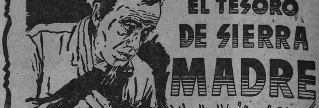
Continúa el éxito en el cine Avenida de la producción de Warner "El tesoro de Sierra Madre", creación de Humphrey Bogart, He aquí a este admirado actor en una escena de la película

2.ª SEMANA DE GRANDIOSO ÉXITO WARNER BROS. PRESENTA