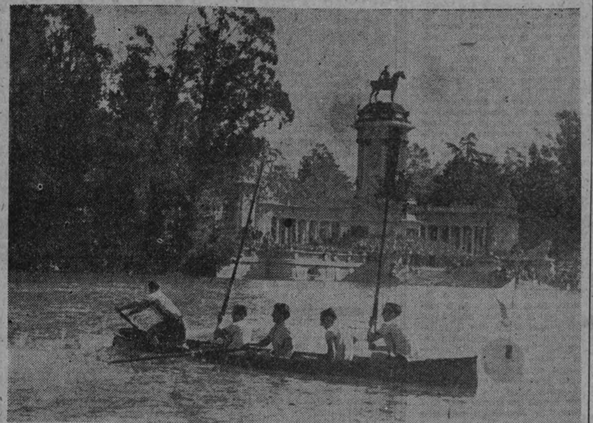
El batel de Iberia de Sestao, campeón de España los años 45 y 46 y uno de los favoritos para el título de esta temporada