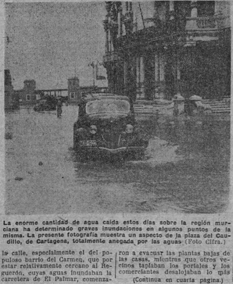
La enorme cantidad de agua calda estos días sobre la región murciana ha determinado graves inundaciones en algunos puntos de la zona. La presente fotografía muestra un aspecto de la plaza del Caudillo, de Cartagena, totalmente anegada por las aguas.