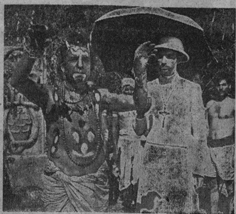
Una escena de la película

Desde los tiempos iniciales de la Obra, la Dirección del Movimiento tuvo una preocupación fundamental: la propaganda. El gran Papa de las misiones, San Pío X, ya quiso que la Obra, además de ser una jornada de oración y de limosna, fuera una jornada de recuerdo para los desmembrados y de asombro y conquista de nuevas almas para los incrédulos. Fue una idea de propaganda misional. Había que despertar en las conciencias dormidas de muchos la responsabilidad de sus deberes, había que hacerles comprender que las misiones eran sus obligaciones para lograr una ayuda eficaz que lograra el logro de una misión misional en la tierra. A partir de entonces, este instrumento de la propaganda se ha perfeccionando a medida que las circunstancias lo permitían, mediante una labor tenaz y eficaz, hasta haber logrado hoy en día un verdadero triunfo.