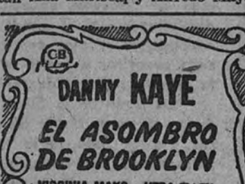
Danny Kaye al frente del reparto... Pero un Danny Kaye que usted desconoce todavía