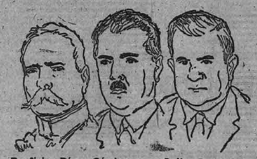
Porfirio Díaz, Cárdenas y Avila Camacho

Publicamos hoy el primero de dos artículos del ilustre escritor mejicano Carlos Septien, que reflejan fielmente el panorama del México actual. El mayor elogio que de Carlos Septien puede hacerse en estas páginas es decir que su temperamento de escritor y de polemista se define por su hispanismo. Su pluma, una de las más vigorosas de México, siempre se mueve en defensa de altos ideales morales. Ha sido durante mucho tiempo director de "La Nación", de aquel país, y en la actualidad forma parte de diversas Comisiones Internacionales Católicas.