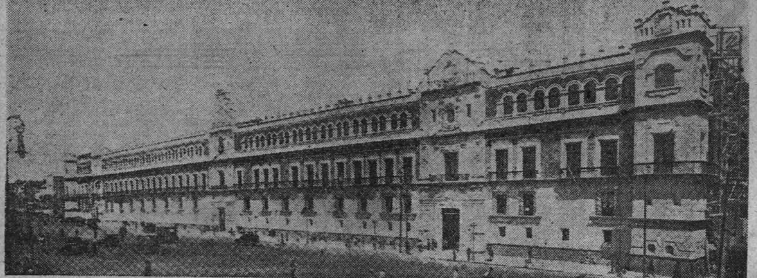
El palacio Nacional