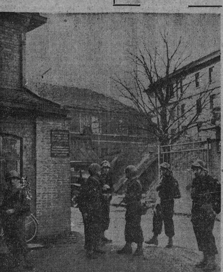
La Policía francesa y miembros del Ejército prestan servicio de protección y vigilancia en los distritos mineros que se encuentran en huelga.