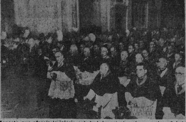
Aspecto que ofrecía la iglesia catedral durante la solemne misa oficiada por el Obispo Patriarca, doctor Elío Garay, con motivo del Sinodo Diocesano.

El Patriarca Obispo ofició en la catedral