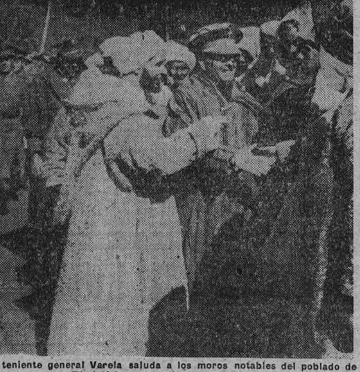
El teniente general Varela saluda a los moros notables del poblado de Tizi-Tizi que acudieron a recibirle.

PARIS 27.—Polonia ha acusado a los Estados Unidos de retrasar el debate en las Naciones Unidas sobre la bomba atómica hasta después de las elecciones presidenciales norteamericanas. El delegado polaco en la O. N. U., Katz-Suchy hizo esta acusación ante la Subcomisión de las Naciones Unidas.