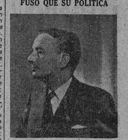
PARIS 27. (Del enviado especial de la agencia Efe. Prohibida la reproducción.)—Bidault vuelve al periódico órgano del M. R. P., "L'Aube", procedente del crepusculo de sus años de ministro de Asuntos Exteriores y hasta de presidente del Gobierno francés.

Hay quien afirma que el único demócrata que ignora la inminencia de su derrota es el propio Presidente Truman. Pero esto no puede ser cierto. Sus más íntimos colaboradores le admiten como inevitable. "Los demócratas, después de dieciséis años de gobierno, están preparando para su "Dunquerque" en Washington", dice hoy el "Times Herald". Y como ejemplo irrefutable se presenta el caso del presidente del Comité Nacional Demócrata, senador Howard Mac Grath. Su actual residencia en Washington la compró en 1945, y ahora, con tres meses de anticipación, está anunciando su venta. "Por cierto—dice un periódico—, que la compró en 33.000 dólares, y ahora la vende por 42.000."