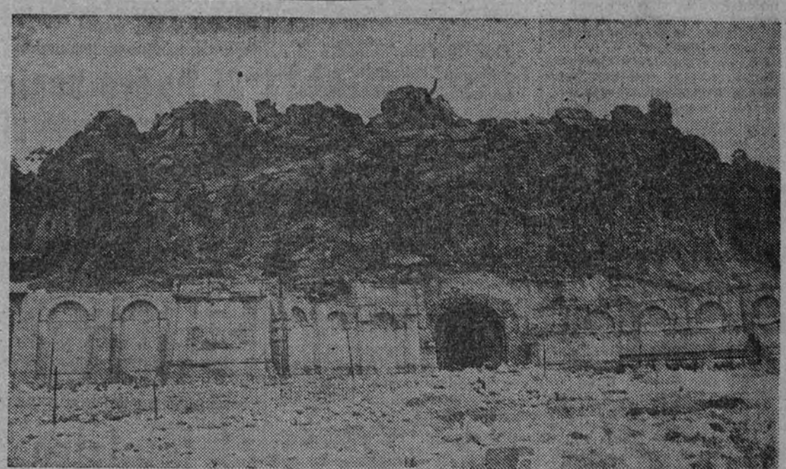
Vista general del Risco de la Mata y entrada a la cripta

Desoendemos del coche que nos ha llevado desde Madrid, al pie del Risco de la Mata. Ascendemos hacia la entrada a la cripta por una serie de escalinatas que van pegadas al monte, siguiendo su configuración, para ganar la altura de los primeros peñones de granito. Hacia la mitad de esta ascensión por las escalinatas nos encontramos con una de las estaciones del Via Crucis, la que hace el número trece. Se trata de un sencillo monumento constituido por tres cruces de granito, siendo la del centro de mayor altura que las laterales. Y llegamos, por fin, a la gran plaza que se construye y embalsada, ante la entrada a la cripta, la plaza de la Exedra. Sus proporciones son enormes: unos 150 metros de