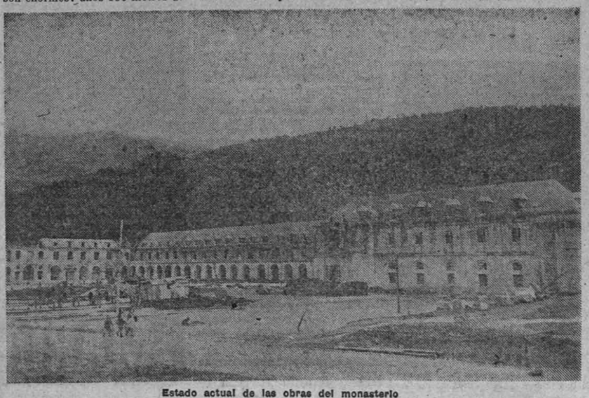
Estado actual de las obras del monasterio

Saliento por detrás de la península, siguiendo el túnel que va desde el fondo de la Iglesia, al concluir el coro, y que es un paso de servicio para la entrada de los frailes desde el monasterio, nos encontramos ante este edificio, cuyas obras van tan adelantadas, que—al terminar de cubrirse aguas con la conclusión de sus tejados—se le pondrá la bandera el día 20 de noviembre próximo, el Día de José Antonio.