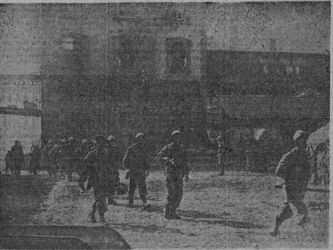
Después de permanecer dos semanas en poder de los huelguistas, las tropas francesas ocupan una instalación minera