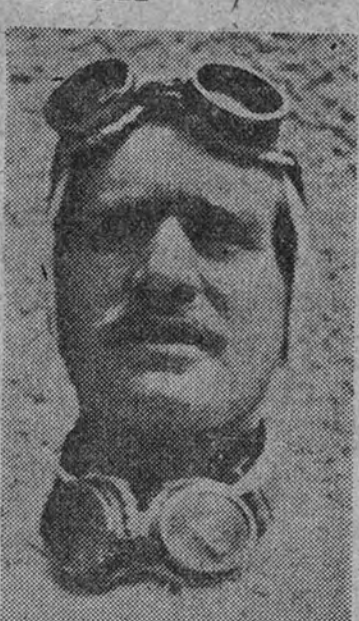
Chiron, De Grafenried, Ascari, Villorresi y el príncipe Bira.

mundiales un equipo de corredores españoles, con motores españoles. Así lo piensa Ricart, y ya hemos visto en la reunión internacional de ingenieros de automóviles lo que por fuera pesan las opiniones de este catedrático del motor.