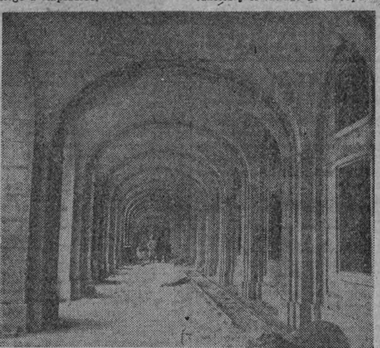
Vista de uno de los soportales del monasterio

Nuestra última pregunta a don Pedro Muguruza ha sido: ¿cuánta obra se podría inaugurar el monumento? —Yo quisiera—han sido sus exactas palabras—que dentro de un par de años se inaugurase. La labor más dura y antipática está ya hecha. Ahora sólo queda rematar cosas. En dos años más confío que habremos dado cima a esta obra; que así como fue el Caudillo el autor de su idea, a él se deberá también, a su tenacidad y a su ilusión patriótica, el que se haya concluido este grandioso monumento a los mártires y a los héroes de esa primera gran batalla al comunismo soviético que el pueblo español, acudido por Franco, ganó para la causa de Dios y del mundo civilizado, y que empezó en julio de 1936.