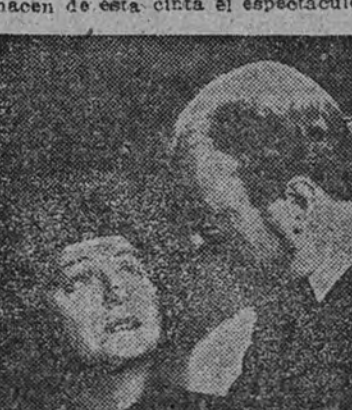
Toda la gama interpretativa de Gaby Morlay está al servicio de la emocionante trama de "El velo azul", que el lunes se estrena en el Imperial, presentada por Isis Films

Una incomparable revista en ochoncolor. Pasado mañana el sumptuoso Capitol ofrecerá a su público el sensacional estreno de la revista en ochoncolor "El Asombro de Brooklyn", cuyo éxito puede asegurarse por descomulgado, dada la extraordinaria valla de cuantos elementos la integran. "El Asombro de Brooklyn", producción Samuel Goldwyn, distribuida por C. E. Films, es la más brillante creación del galán cómic Danny Kaye, al que acompañan la bellísima Virginia Mayo y las "girls" de Goldwyn. Su alegro argumento, la perfección de su colorido, la belleza de su música, sus espléndidos decorados, su riquísimo vestuario, hacen de esta cinta el espectáculo más sorprendente y alegre ofrecido hasta hoy por el cine.