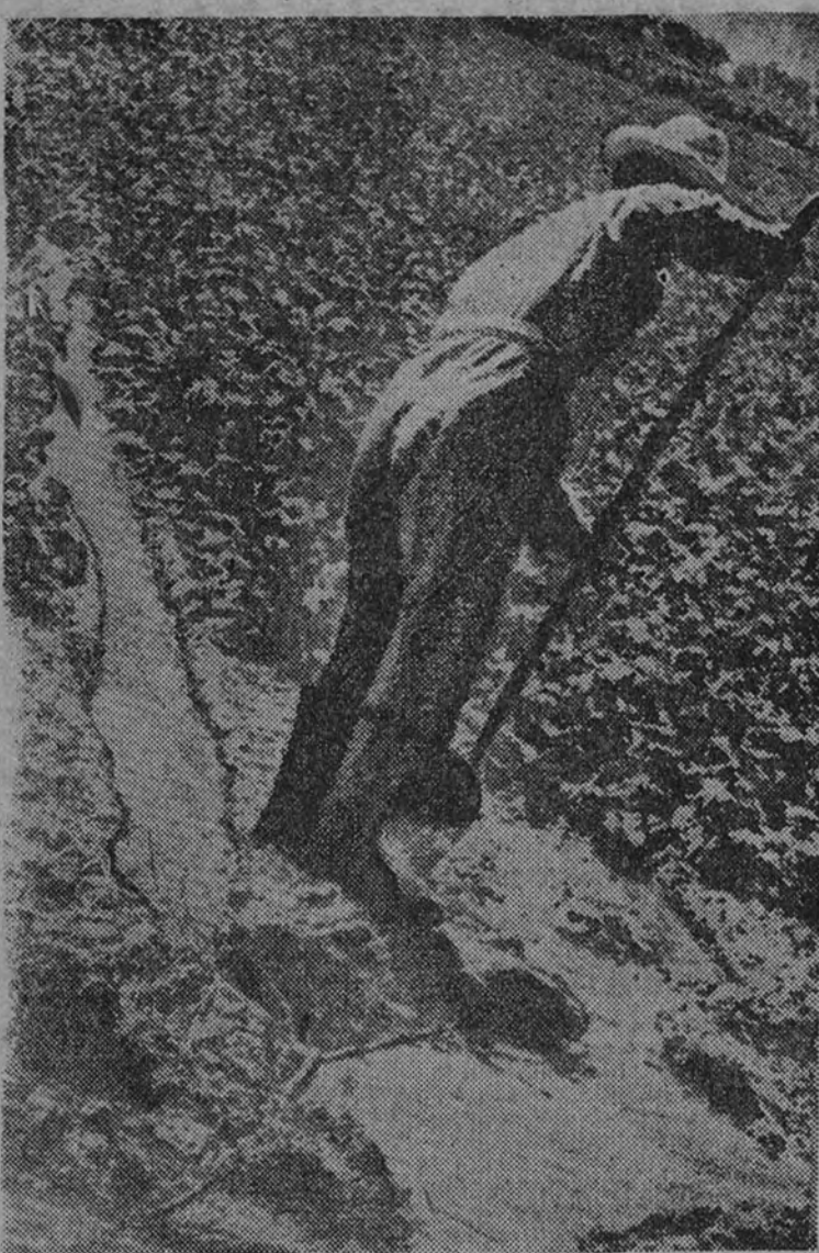
Fechas del campo

La provincia necesita 50.000 hectáreas de regadío