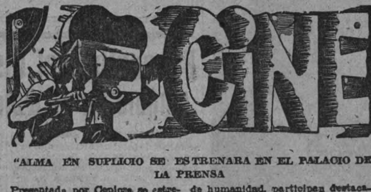
Presentada por Cinesa se estrenará el próximo lunes en el sumptuoso Palacio de la Prensa otra gran comedia dramática de la Warner Bros. que proporciona a Joan Crawford ocasión para desempeñar el mejor papel de su carrera, y por el que consiguió el ansiado "Oscar" de la Academia de Artes y Ciencias Cinematográficas de Hollywood.