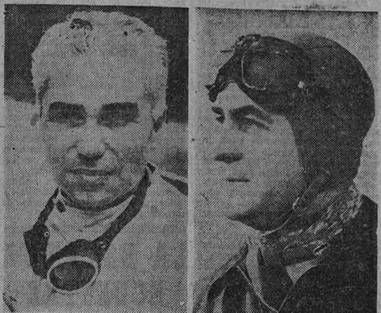
Va se encuentran en Barcelona las grandes figuras del volante. Taruffi (italiano) y Rosier (francés), que participarán en el Gran Premio Peña Rhin

La lluvia que cayó durante el día y la noche anterior ha retardado el primer entrenamiento. Los corredores no buscaron el máximo rendimiento de los motores, más preocupados por el estado del circuito y la moderación de la lluvia. Pero, a pesar de esto, se han hecho algunas pruebas de velocidad. Los participantes en el primer entrenamiento de Peña Rhin, al que concurrirán la casi totalidad de los jugadores del Club. Desde luego, puede darse por segura la alineación de Pont y Montalvo. Ambos se encuentran mejorados y con muchas ganas de jugar un partido que tanto interés ha despertado y que tanto puede suponer para la clasificación del equipo.