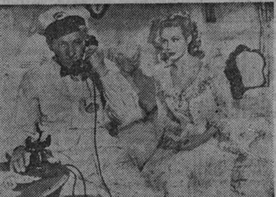
La revista en ochoncolor "El Asombro de Brooklyn" será presentada por C. E. Films el lunes en la pantalla del Capitol. El gracioso galán Danny Kaye, con Virginia Mayo y las bellas "girls" de Samuel Goldwyn y n. Interpretan esta espectacular película