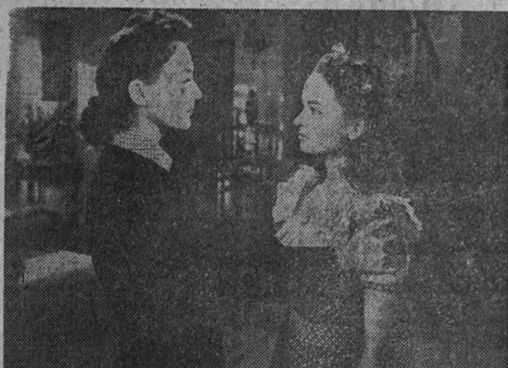
La Academia de Arte y Ciencias Cinematográficas de Hollywood premió con el "Oscar" la labor de Joan Crawford en "Alma en Supplicio", la magnífica realización de Michael Curtiz que, presentada por Copeiros, triunfará desde mañana en la pantalla del Palacio de la Prensa.

Mañana estrena el aristocrático cine Callao otra gran película en tecnicolor, de Paramount, presentada por Mercurio Films, S. A. "Por el valle de las sombras", dirigida por el famoso Cecil B. de Mille, que ha conseguido una de esas obras maestras de la cinematografía que nos tiene acostumbrados.