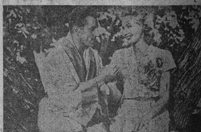
Las mujeres más bellas de Hollywood han sido reunidas por el productor Goldwyn para su espectacular revista en technicolor "El asombro de Brooklyn", que como protagonistas interpretan Danny Kaye y Virginia Mayo—que aparecen en esta foto—, y que O. B. Films estrenará mañana en el Capitol.

Con este film se estrena el lunes, en el Imperial, el primer capítulo de la serie documental "Así es Cataluña". Un programa auténticamente extraordinario.