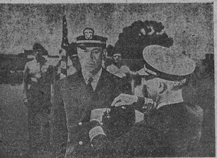
Gary Cooper en una escena de su admirable creación "Por el valle de las Sombras", technicolor dirigido por Cecil B. de Mille para Paramount, y cuyo estreno anuncia Mercurio para mañana en la pantalla del cine Callao.

Entre los aciertos de "Las aguas bajan negras" hay que destacar el tipo y el gesto de Carmina, la heroína de este poema cinematográfico de Colonial Aje.