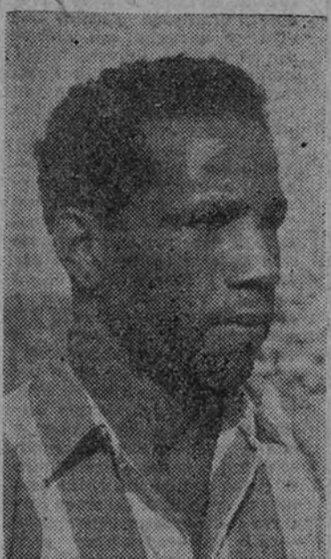
Ben Barek fué en Sabadell una de las figuras del Atlético y el autor del primer tanto de su equipo.

En el segundo tiempo el dominio fué abrumador. Todo el equipo jugó, y bien. No deberían señalarse preferencias, pero como es objeto de especial curiosidad la delantera, diremos que se movió con tal penetración y eficacia, que sólo una gran fortuna de los catalanes les impidió perder en su propio terreno por un tanto escandaloso. Se ha hablado de Ben Barek, acaso porque no acababa de encajar su precioso tiro en el juego español. En Sabadell el marcador lució toda la gama de su saber jugar para los demás, y éstos correspondieron. Hizo verdaderas fantasías. Su actuación fué superior al día del Real Santander, una de las más felices tardes de Larbi. Sus compañeros no desmerecieron. Silva fué otro artífice; Escudero y Juncosa, los elementos eficaces y peligrosos de siempre, y Vidal mejoró sus anteriores partidos.