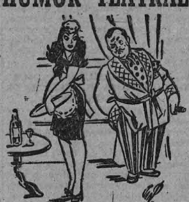
"El amor de un señorito", divertida escena de "YO SOY CASADO, SEÑORITA", el mayor éxito del teatro Martín