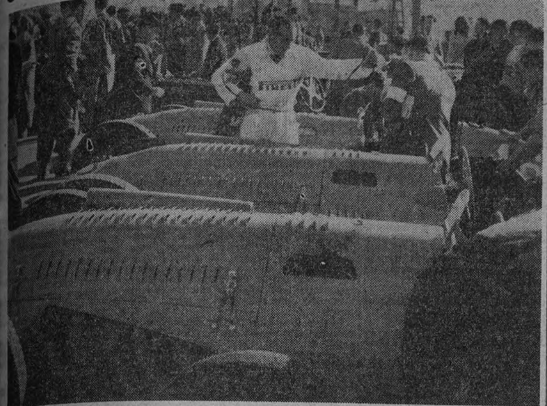
La Peña Rhin puede quedar como modelo de organización de una prueba automovilística, y así fué reconocido por los corredores extranjeros. No faltó ni el más pequeño detalle, tanto en el circuito como en los boxes para los coches participantes.

Veinticuatro años de crítica deportiva nos han permitido ver innumerable cantidad de organizaciones de las más diversas modalidades. Raras veces hemos censurado los defectos de muchas de ellas, porque para nosotros ha sido muy poderosa la razón romántica. Quiénes se des-