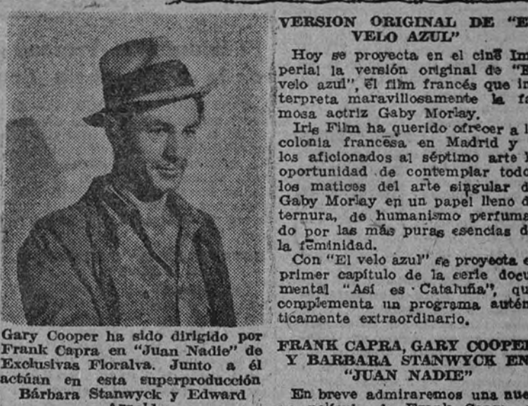
Gary Cooper ha sido dirigido por Frank Capra en "Juan Nadie" de Exclavitas Florvalva. Junto a él actúan en esta superproducción Barbara Stanwyck y Edward Arnold.

FRANK CAPRA... GARY COOPER... BARBARA STANWYCK... EDWARD ARNOLD... Juan Nadie