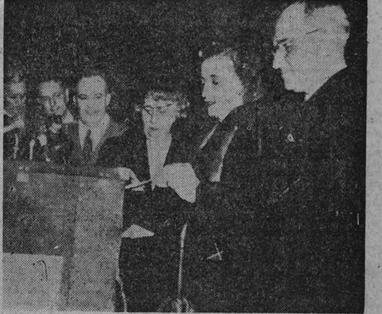
El Presidente Truman, en unión de su esposa y de su hija, deposita su voto—creemos que con su propio nombre—en una urna electoral de Independence, su ciudad natal. (Foto Philips.)

"Va a haber muchas caras coloradas en Washington", dijo al abandonar Independence