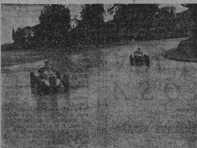
En este mismo circuito de Pedralbes es probable que se celebre el Gran Premio de Europa, fórmula 2.

También se piensa en la organización de otro Gran Premio en Madrid