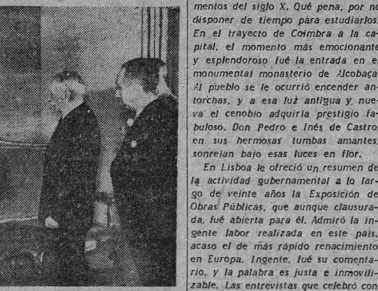
El Ministro de Educación Nacional, señor Ibáñez Martín, cumplimentó al jefe del Estado y al presidente del Consejo de la nación portuguesa. Nuestras fotografías muestran un aspecto de ambas entrevistas, a las que asistió asimismo el embajador de España en Portugal, don Nicolás Franco.