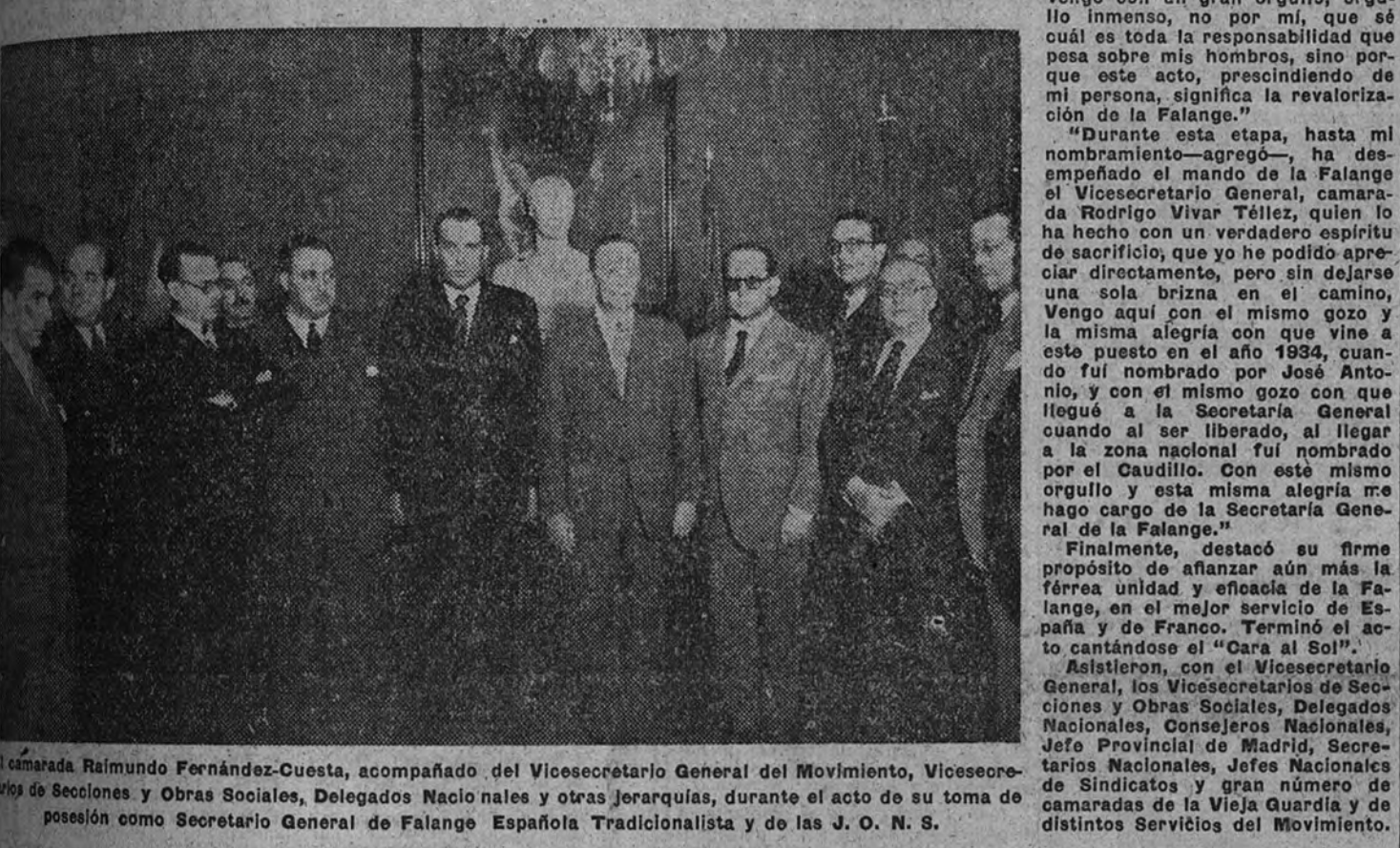
El camarada Raimundo Fernández-Cuesta, acompañado del Vicesecretario General del Movimiento, Vicesecretario de Secciones y Obras Sociales, Delegados Nacionales y otras jerarquías, durante el acto de su toma de posesión como Secretario General de Falange Española Tradicionalista y de las J. O. N. S.