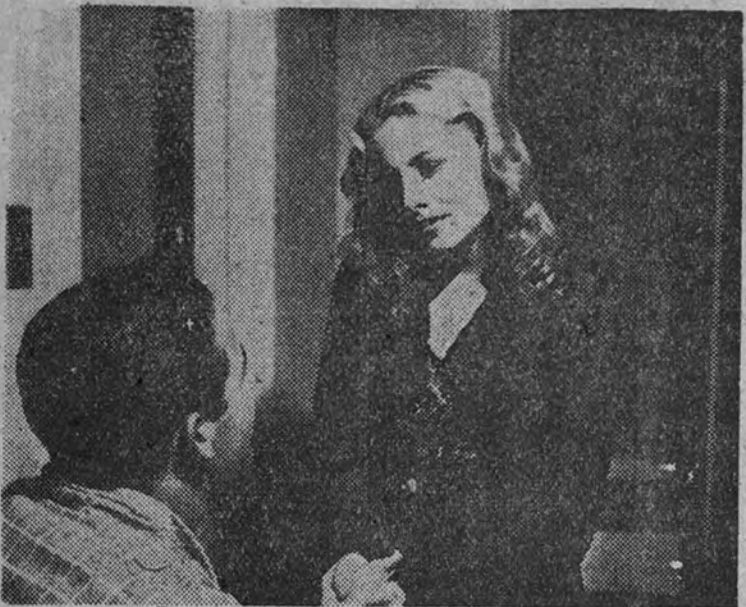
De nuevo Joan Fontaine, la inolvidable creadora de "Rebecca", despierta la admiración del público por su arte y su belleza en la película "De hoy en adelante", que distribuye C. B. Films y que el elegante Real Cinema estrenará mañana lunes