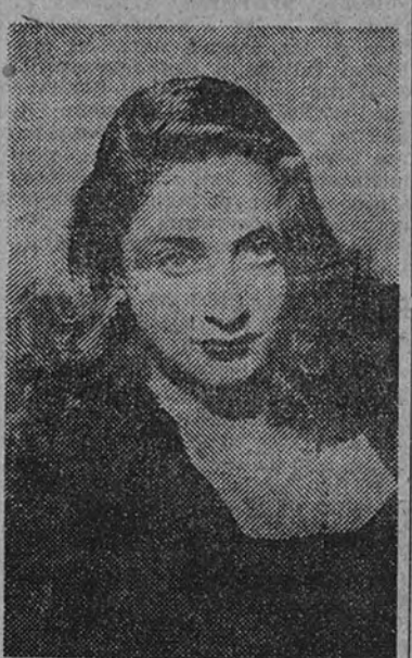
Maravillosa actriz que presentará mañana noche en el Beatriz una representación originalísima de "Don Juan Tenorio". En cada acto representará el papel de El Burlador un autor o literato famoso, a los que dará réplica esta genial artista