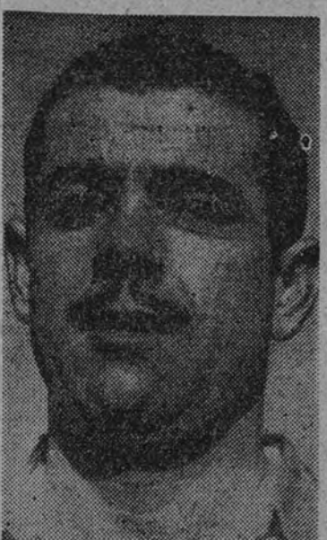
EL FRANCÉS DARD DIRIGIRÁ EL ATAQUE MALAGUERO FRENTE AL ATLETICO

Me Patton, el campeón olímpico que en Londres asombró a tantos mil-