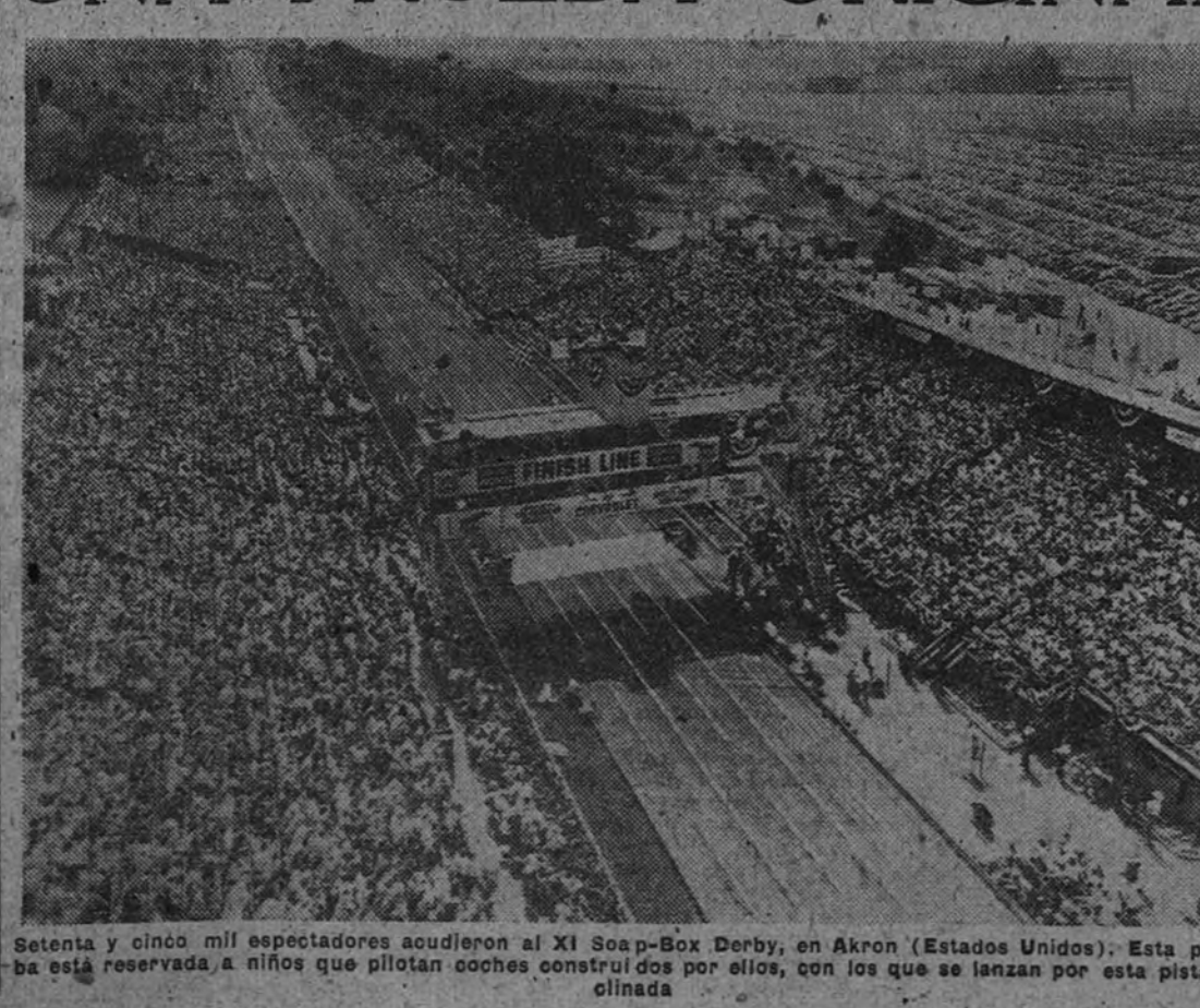
Setenta y cinco mil espectadores acudieron al XI Soap-Box Derby, en Akron (Estados Unidos). Esta prueba está reservada a niños que pilotan coches contruados por ellos, con los que se lanzan por esta pista inclinada.