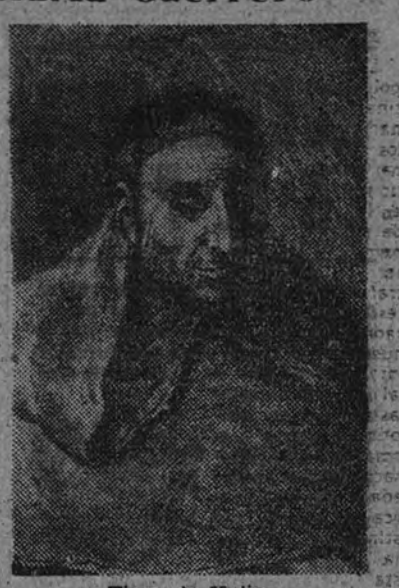
Tirso de Molina