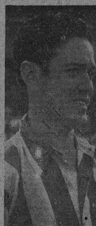
hemos tratado de menudear, sino de posibilidades de mejoramiento para un futuro. Como amigos, casi no podemos

En el segundo tiempo, el francés Dard, que jugó de delantero centro con el Málaga, sin hacer nada de particular, marca el cuarto tanto para su equipo, consiguiendo el empate. Basabe a los pocos minutos.