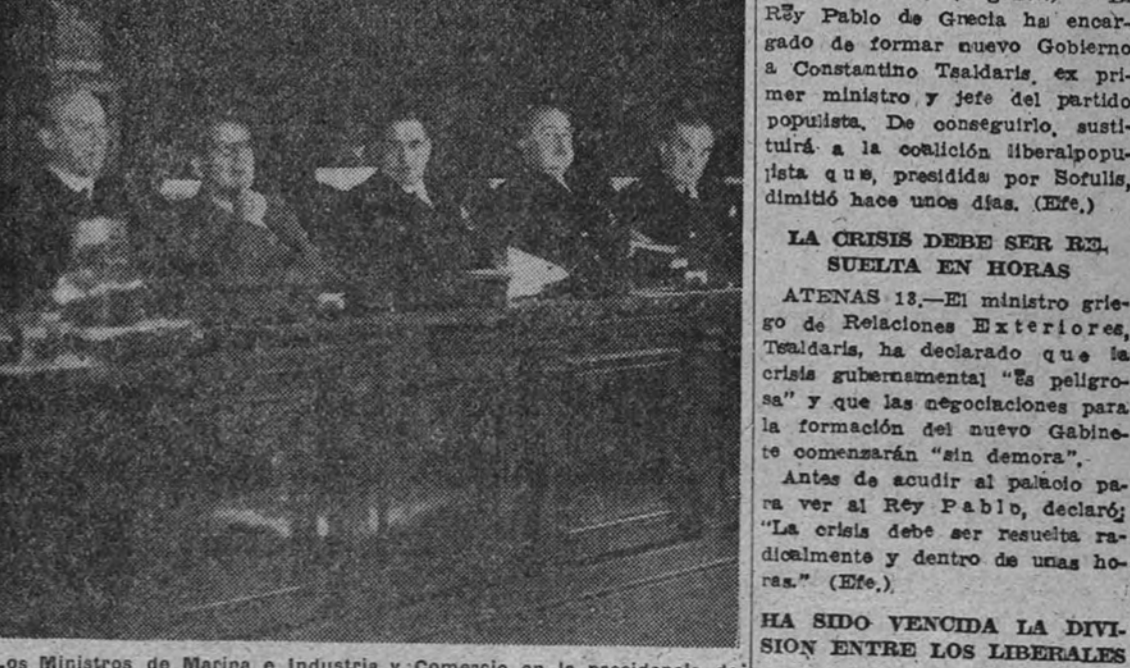
Los Ministros de Marina e Industria y Comercio en la presidencia de la sesión de clausura del Congreso de Ingenieros Navales

Pronunció un importante discurso el Ministro de Marina