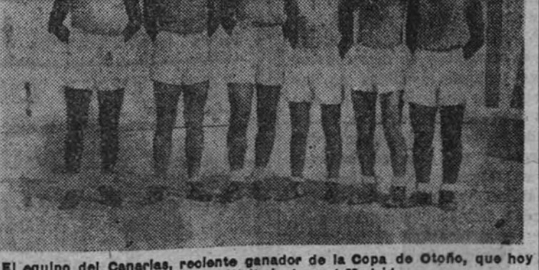
El equipo de Canarias, reciente ganador de la Copa de Oporto, que hoy tendrá un difícil rival en el Madrid

pues por la igualdad de fuerzas, las diferencias a favor de unos u otros suelen ser mínimas.