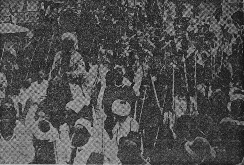
El Kaiser cruza las calles de Tánger

Y he aquí que aparece por primera vez la palabra "Tánger" en un tratado entre Francia y España. Estamos en fecha de 3 de octubre de 1904. De modo que en el artículo 2.º de la Declaración anglofrancesa de 1904, en la que está comprendida Tánger, y luego, en el artículo 9.º, se declara que esta ciudad conservará el carácter especial, etcétera. No sabemos qué carácter especial podría ser éste, ya que la presencia en Tánger de representantes consulares no le da ningún carácter especial, sino convencional; ni tampoco el carácter especial nace de la presencia consular, o viceversa. Además, cualquiera comprende que la frase "carácter especial" es lo más impreciso y vago que pudiera emplearse en sentido diplomático, a no ser que en la imprecisión y la vaguedad residiera la futura eficacia. Pero, en fin, con el carácter especial que fuera, lo cierto es que Tánger pertenecía de lleno a nuestra Zona de influencia, con acción semejante a la que Francia ejerciera en la suya.