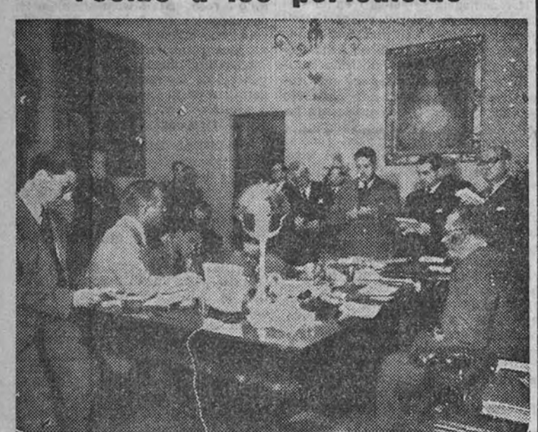
El Ministro de la Gobernación informa a la Prensa nacional y extranjera sobre los resultados de las elecciones municipales en toda España

El domingo, a las diez de la noche, el Ministro de la Gobernación, don Blas Pérez González, recibió a los representantes de la Prensa nacional y extranjera. Se hallaban presentes en el despacho oficial los Ministros de Educación Nacional y Agricultura, el Subsecretario de Educación Popular, el de la Gobernación y los directores generales del Departamento. El señor Pérez González dio cuenta a los informa-