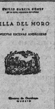
SILLA DEL MORO