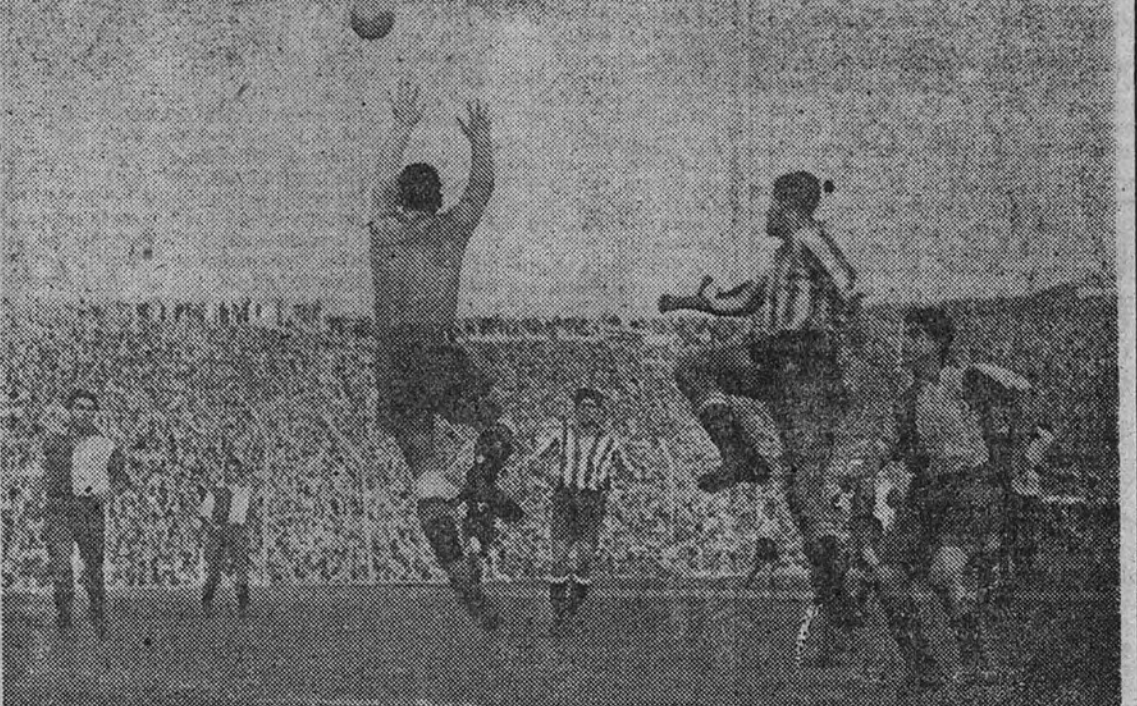
El meta bilbaíno, Lezama, salta para apoderarse de un balón que llevaba camino de su puerta y que intentaba rematar el madrileño Escudero