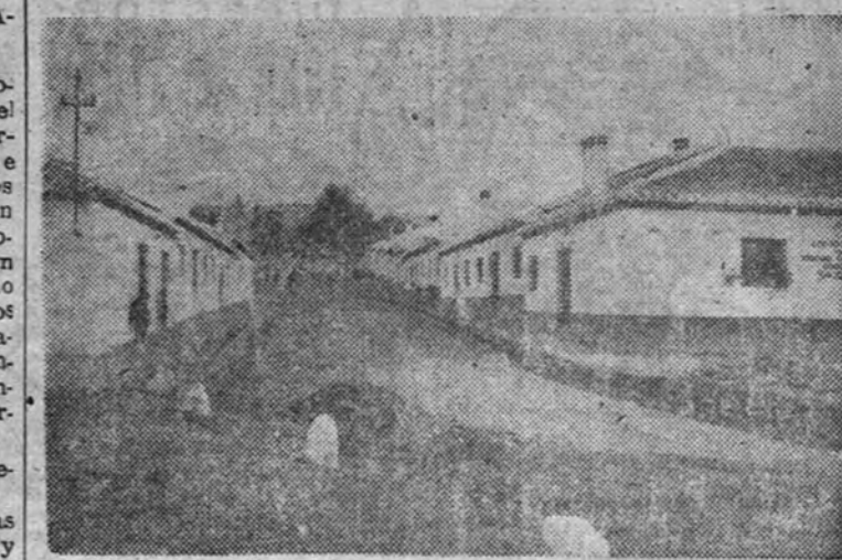
na viviendas en Almuñécar

FERROCARIL GRANADA DA-MOTRIL. Ante la imposibilidad de poder reducir a unas cuartillas el contenido de un proyecto de ordenación económica social que afecta a esta provincia, tenemos por fuerza que limitarlo al orden con que fueron señalados, no como más o menos importantes, sino sus diferentes ordenaciones, sin dando la preferencia a aquellos que por su preponderancia de resultados inmediatos atañecan entre los demás problemas provinciales; como necesidades primordiales. Entre todos ellos destaca el ferrocarril de Granada a Motril. Considerando en virtud de las razones agrícolas, económicas