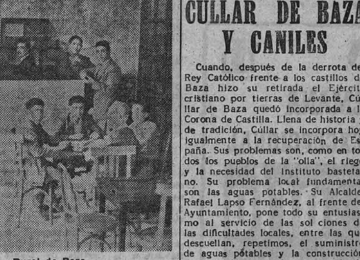
Un aspecto del Hogar Rural de Baza

LA MEDALLA DE ORO DE LA CIUDAD Y LA FERIA DE MUESTRAS El Ayuntamiento de Baza acordó, en homenaje al Caudillo, crear la Medalla de Oro de la Ciudad, con carácter único, que le será otorgada, próximamente, haciéndose portar por el Ayuntamiento del clamor popular hacia el defensor de la Patria y de la Fe. En nuestro peregrinar por la ciudad hemos llegado a la Casa de la Falange, edificio propiedad del Movimiento, que ofrece el curioso caso, impar en España, de tener en sus locales todas las entidades relacionadas con el Movimiento. Jefatura Local y Comarcal, Hermandad de Labradores, C. N. S., Frente de Juventudes, Guardia de Honor del Hogar del Productor, etc., ofrecen en la Casa de la Falange una perfecta organización. Queremos hacer especial mención al Hogar, verdadero modelo de su género, y, sobre todo, de los "solares" dedicados a la obra "18 de Julio", que tienen instalada una clínica perfecta, con todos los modernos adelantos: lámpara sin sombras, instrumental, mesas de operaciones, etc., algo digno de ver y de elogiar. En esta misma Casa de la Falange se celebró este año desde el 7 al 15 de septiembre la Primera Feria Regional de Muestras, anteriormente había ferias, pero sin este carácter, que fue un hecho de importancia realmente nacional. Se dividió en cinco secciones: