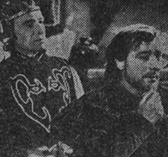
Escena de la producción Manuel del Castillo "Doña María la Brava", que con el mayor éxito exhibe la distribuidora Cépica en el cine Gran Via

Esta gran realización de Frank Capra, que ha presentado con tan singular éxito en el lujoso cine Avenida Exclusivas Floraviva, sigue exhibiéndose con llenos diarios, ya en cuarta semana triunfal.