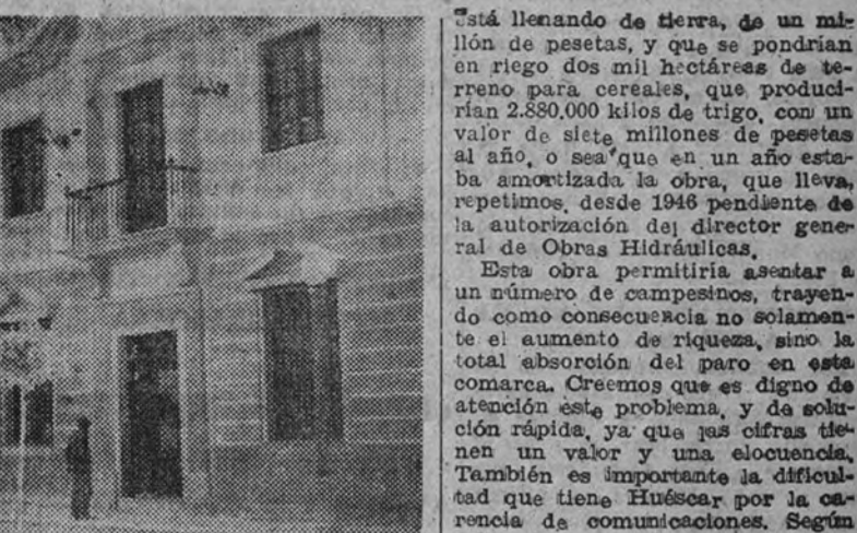
Casa de los Juzgados, de reciente construcción

EL PLAN DE ORDENACIÓN URBANA Es algo interesante destacar el magnífico plan de ordenación urbana que se ha elaborado a petición del Ayuntamiento y a cargo del mismo. Hemos visto personalmente los magníficos planos de transformación de