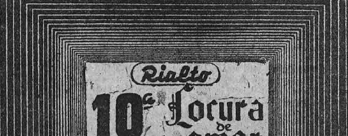
10ª Semana Triunfal. Locura de amor. EXITO SIN PRECEDENTES

"Juan Nadie", éxito auténtico del cine americano y de Frank Capra, ha causado tan gratísima impresión entre nuestros aficionados.