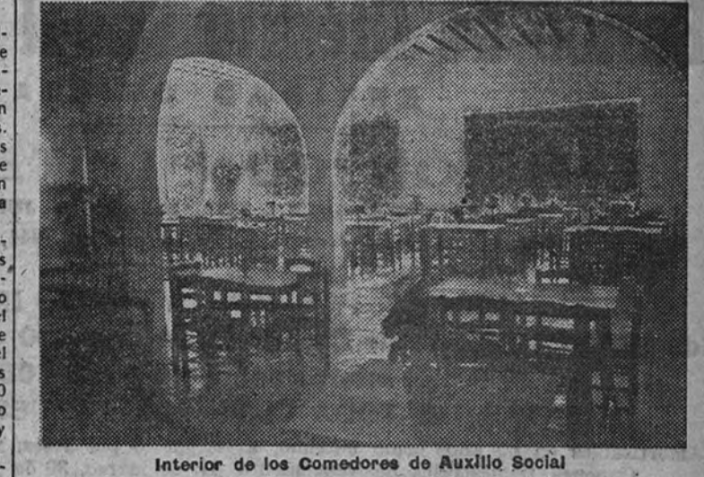
Interior de los Comedores de Auxilio Social

EDIFICACIONES URBANAS Fructos de esta obra de transformación urbana que realiza el Ayuntamiento de Huéscar, se la construcción, realizada ya de una casa para el Juzgado de Instrucción y Comarcal, una especie de Palacio de Justicia Municipal, magnífico edificio con viviendas para los dos jueces, amueblado con sobria dignidad también por cuenta de la Corporación y que tiene una sala de audiencias de las mejores que hemos visto. También el Ayuntamiento ha donado importantes cantidades a para