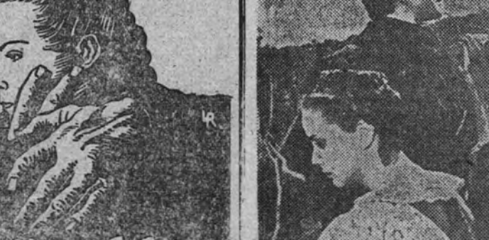
Alida Valli y Giorgio de Lullo viven en la pantalla la romántica historia de "Eugenia Grandet", del novelista Honorato de Balzac, en la producción Minerva que, presentada por Cífica, se estrenará próximamente

Hannelore Schroth, encantadora, joven y novel estrella que constituye una auténtica revelación, forma a la cabeza de un selecto conjunto de artistas, entre los que también figura Paul Hörbiger. Con "La manicura del Gran Hotel" se proyectan los capítulos octavo y noveno de la serie documental "Así es Cataluña".