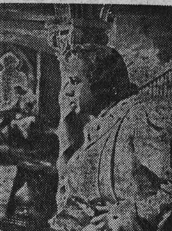
PERSONAJES CENTRALES DE "EUGENIA GRANDET"