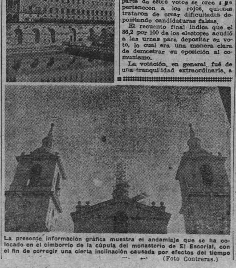
La presente información gráfica muestra el andamiaje que se ha co- locado en el cimborrio de la cúpula del monasterio de El Escorial, con el fin de corregir una cierta inclinación causada por efectos del tiempo