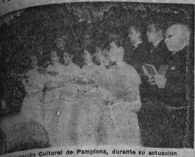
La Agrupación Cultural de Pamplona, durante su actuación

Un grupo de entusiastas representantes de la Agrupación Cultural de Pamplona, en el Ateneo de Madrid, durante su actuación. El grupo, dirigido por el maestro Luis Moya, presentó un programa de canciones populares de su tierra, que fueron muy bien recibidas por el público.