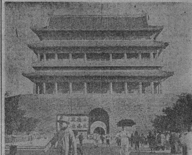
Una de las puertas de Pekín

Los nacionalistas han sufrido graves reveses en las regiones vitales de todos los frentes de combate