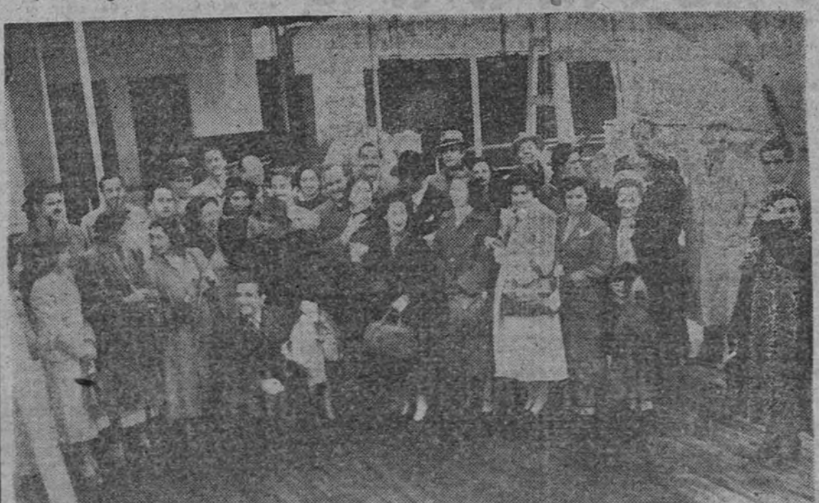
Han llegado al puerto de Santander los componentes de la embajada artística del Perú, que vienen invitados por el Instituto de Cultura Hispánica para visitar nuestra Patria