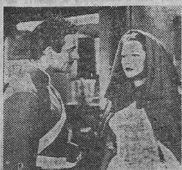
Palacio del Cine y Proyecciones re- estrenarán la creación de María Montez titulada "Piratas de Mon- terrey", de la que reproducimos este fotograma