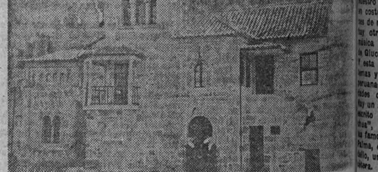
Casa del Orfanato Virgen del Carmen, adosado al templo votivo del Mar