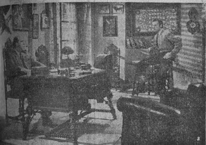
El suntuoso Palacio de la Prensa ofrecerá mañana el estreno de "Brindis a Manolete", de Héroules Films. Dirigida por Florian Rey, es un homenaje a la memoria del gran torero cordobés. Manolo Morán y José Greco en una de las escenas

Además: ASI ES CATALUÑA Capítulo XII: BARCELONA MEDIOEVAL. XIII: BARCELONA Y SU PUERTO