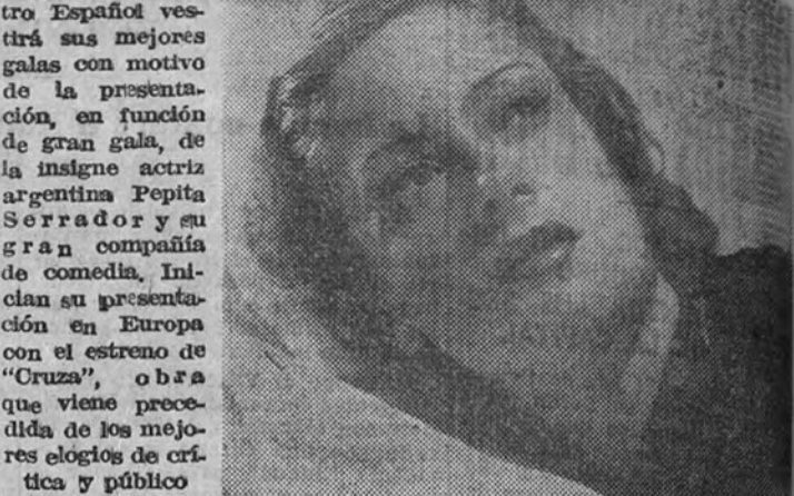
El próximo día 1 de enero, el teatro Español vestirá sus mejores galas con motivo de la presentación, en función de gran gala, de la insigne actriz argentina Pepita Serrador y su gran compañía de comedia. Iniciará su presentación en Europa con el estreno de "Cruza", obra que viene precedida de los mejores elogios de crítica y público.

Pepita Serrador se presenta el 1 de enero