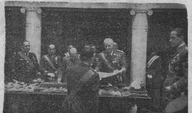
Los Ministros del Ejército, Marina, Aire y Obras Públicas, entregando los diplomas a los nuevos oficiales de Estado Mayor

Asistieron los Ministros de Ejército, Marina, Aire y Obras Públicas