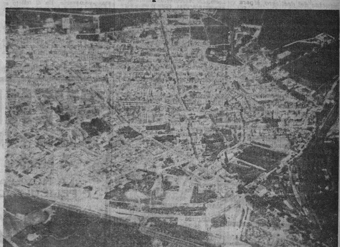
Vista aérea de Ciudad Real

Un sanatorio modelo para la Obra "18 de Julio"