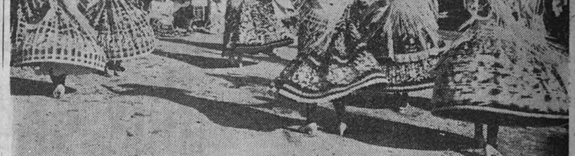
El Grupo de Coros y Danzas de Yecla, en Madrid. Arriba, en el Retiro. Abajo, en el vestíbulo del Español.