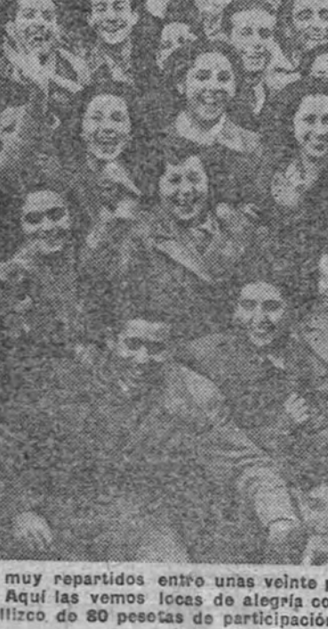
Los treinta millones del segundo premio, a Barcelona, y los quince del tercero, a Huelva