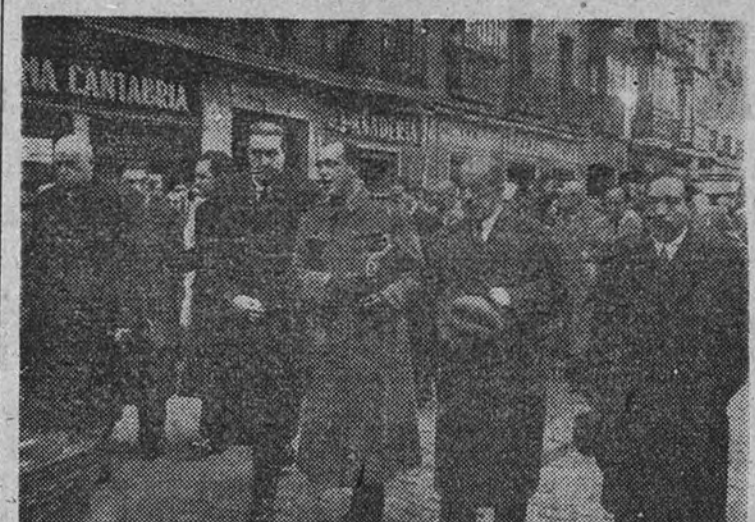
El Ministro de Asuntos Exteriores con el director general de Seguridad y otras personalidades, presidiendo el duelo

Figuró en la presidencia el Ministro de Asuntos Exteriores