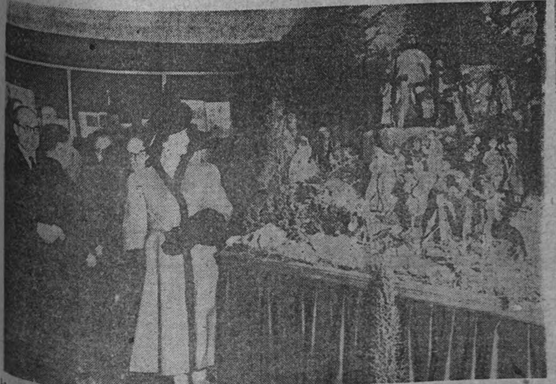
La esposa del Caudillo, doña Carmen Polo de Franco, acompañada del Ministro de Educación, señor Ibáñez Martín, y otras personalidades, asiste a la inauguración de la Exposición Bibliográfica de Navidad, celebrada en la Biblioteca Nacional

Presidieron el acto la esposa del Caudillo, el Ministro de Educación y otras personalidades