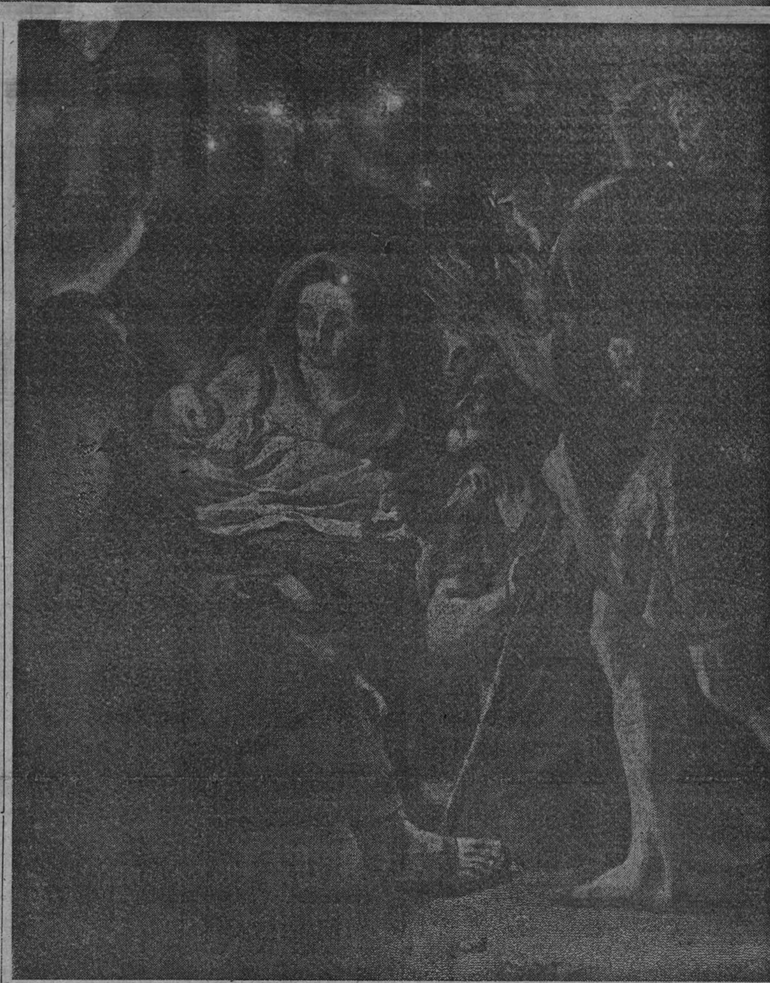
Esta es la tabla del nacimiento que pintó en Roma el caballero Menga, y está en el Real Palacio de Madrid.