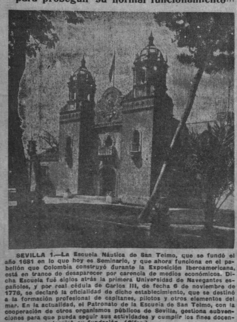
SEVILLA 1.—La Escuela Náutica de San Telmo, que se fundó el año 1881 en la hoy ex Seminario, y que ahora funciona en el pabellón que Colombia construyó durante la Exposición Iberoamericana, está en trance de desaparecer por carencia de medios económicos. Dicha Escuela fue el primer establecimiento de enseñanza náutica en España, y fue real cédula de Carlos III, de fecha 6 de noviembre de 1778, se declaró la oficialidad de dicho establecimiento, que se destinó a la formación profesional de capitanes, pilotos y otros elementos del mar. En la actualidad, el Patronato de la Escuela de San Telmo, con la cooperación de otros organismos públicos de Sevilla, gestiona subvenciones para que pueda seguir sus actividades y cumplir los fines docentes en que se inspiró su fundación. (Olfra.)