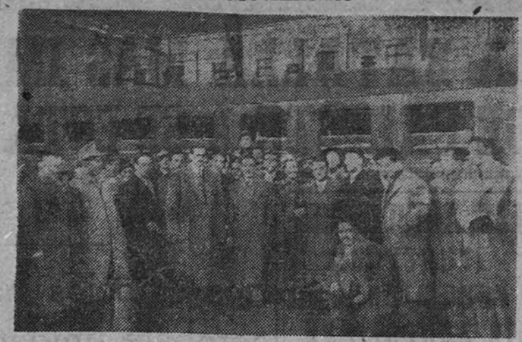
Los universitarios italianos a su llegada a la estación del Norte.

Fueron recibidos por el Secretario General del Movimiento