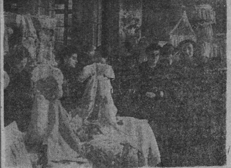
La Delegada Nacional de la Sección Femenina, camarada Pilar Primo de Rivera, durante la inauguración de la Exposición de canastillas que se celebra en el Círculo de Bellas Artes de Madrid.