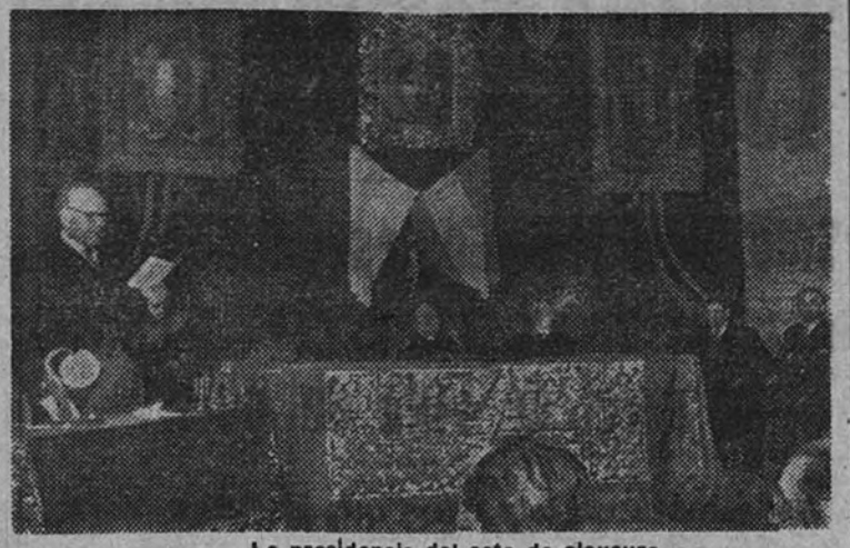
La presidencia del acto de clausura

Ayer, tarde, a las cinco, se verificó el acto de clausura de la Semana de Educación Nacional, organizada por la Federación de Amigos de la Enseñanza.