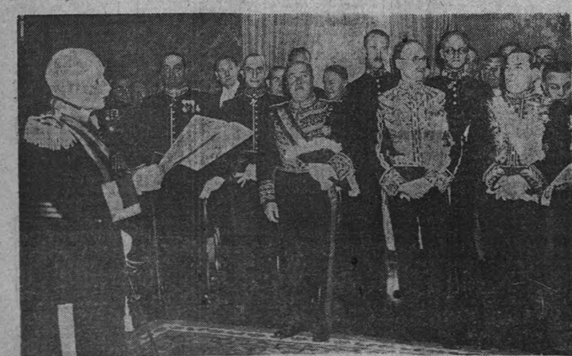
El Presidente de la República portuguesa, mariscal Carmona, durante la recepción ofrecida al Cuerpo diplomático acreditado ante él, con motivo del Año Nuevo. Entre los diplomáticos aparece el embajador de España, don Nicolás Franco, junto a los embajadores de Inglaterra y Brasil, a su izquierda.