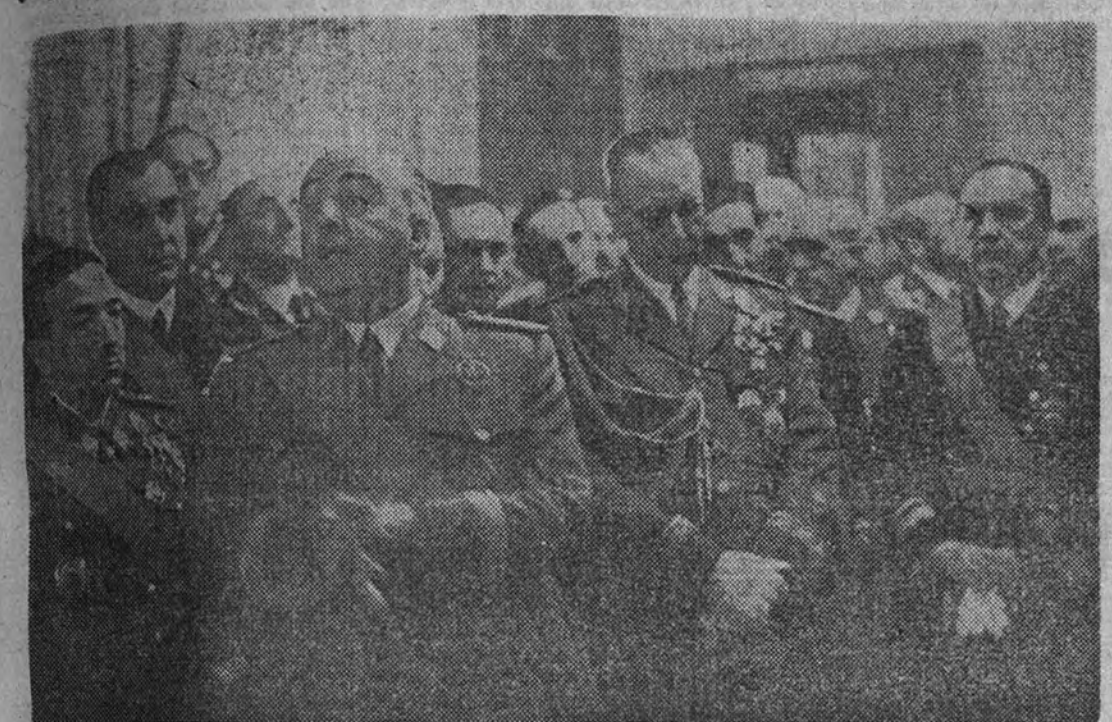
Su Excelencia el Jefe del Estado durante el discurso pronunciado con motivo de la recepción de la Pascua militar.

Asistieron los Ministros de Marina, Aire, Gobernación, Justicia e Industria y Comercio y amplias representaciones militares