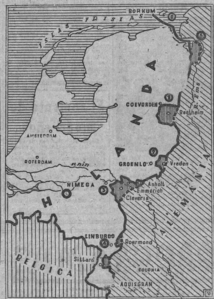
Las seis rectificaciones fronterizas solicitadas por Holanda en 1947

LONDRES 11.—El diputado laborista Mackay, conocido abogado de la unión europea, declaró a los periodistas que si los Estados Unidos se limitan a dar dinero a este continente sin insistir en que se usen los países del mismo, están tirando el dinero por la ventana. "Y eso es lo que está ocurriendo—prosigue—, pues cada nación europea pide la ayuda Marshall para tratar de hacer económica y políticamente independiente, cuando la solución de los problemas de todos está exclusivamente en poner en común sus recursos y organizar la recuperación económica como si se tratase de una sola nación." (Efe.)