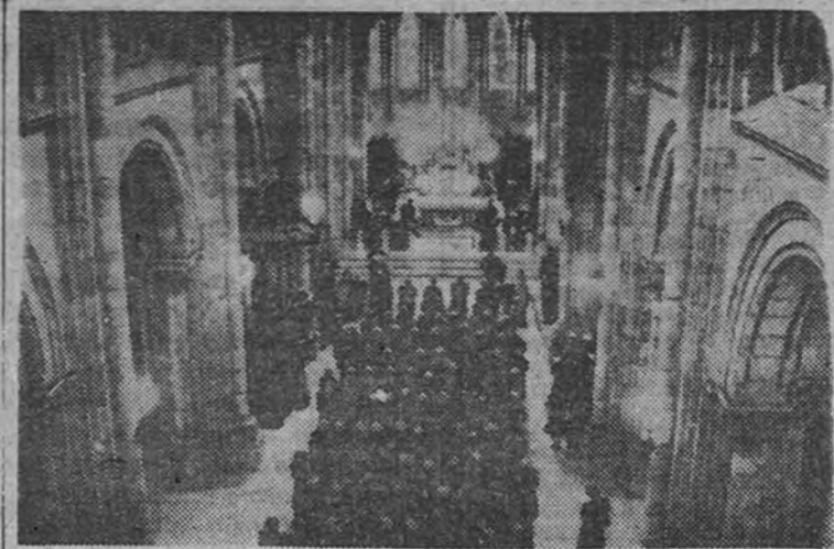
Un aspecto de la basílica de Covadonga durante la misa celebrada con motivo de la inauguración de las tareas de dicho Congreso Nacional