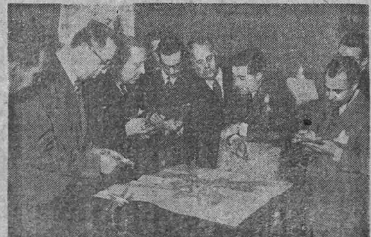
El Ministro del Aire, general Gallarza, rodeado de los informadores, a quienes hizo ayer unas importantes declaraciones.

"En el año último han quedado terminadas—declaró el Ministro—las grandes pistas de nuestros tres aeropuertos transoceánicos: Barajas (Madrid), Prat de Llobregat (Barcelona), y San Pablo (Sevilla). En este año se harán grandes pistas en otros aeropuertos militares y civiles, que servirán de auxiliares de los tres aeropuertos transoceánicos. Este año se terminará la pista del aeródromo bilbaíno de Sondica, que quedará abierto al tráfico."