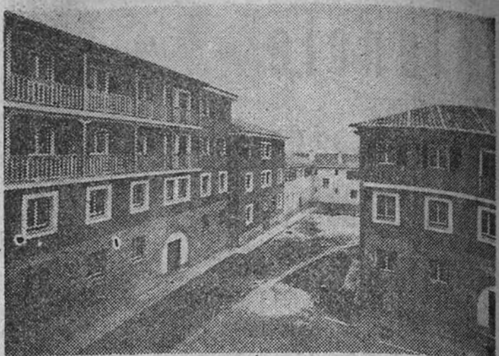
Viviendas para mineros de La Camocha

Las viviendas que se encuentran ya terminadas son: Mieres-Norte, 16; Mieres, 364; Las Lleras, Ujo, 208; Caborana, 306; Bilinea, 363; Ciaño, fábrica, 206; La Camocha, 188; Tuilla, 216; Pola de Laviana, 192; El Coto, 233; Santa Ana, Ciaño, 80; Tudela Vega, 66; Sotondio, 120; Lada,