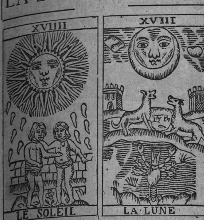
Arcaicos procedentes de un juego de "taroccos" editados en Marsella (siglo XVIII)

Los periódicos del domingo, dieron noticia del fenómeno celeste observado en Avila, durante la noche del 14 al 15.