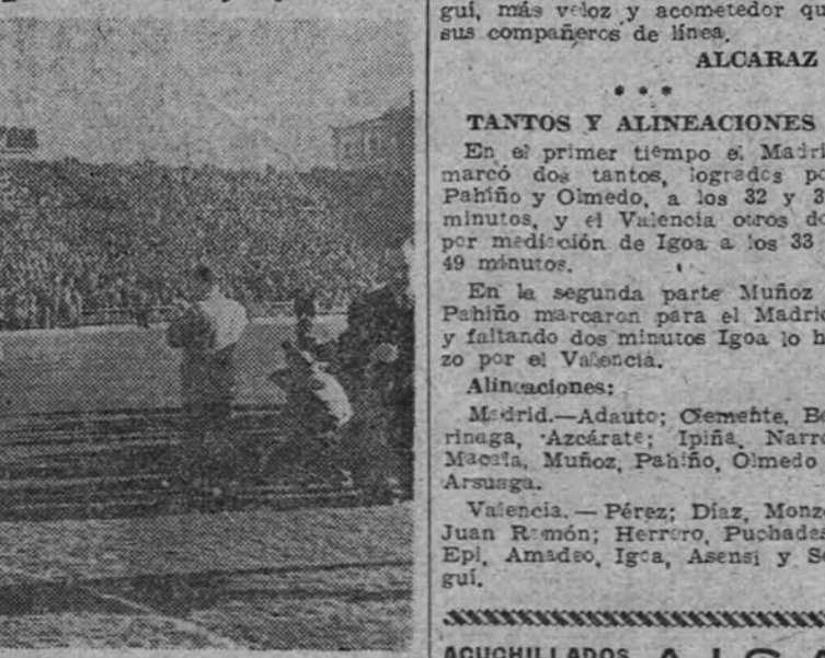
El equipo del Madrid posa para los fotógrafos momentos antes de dar comienzo el partido del domingo con el Valencia