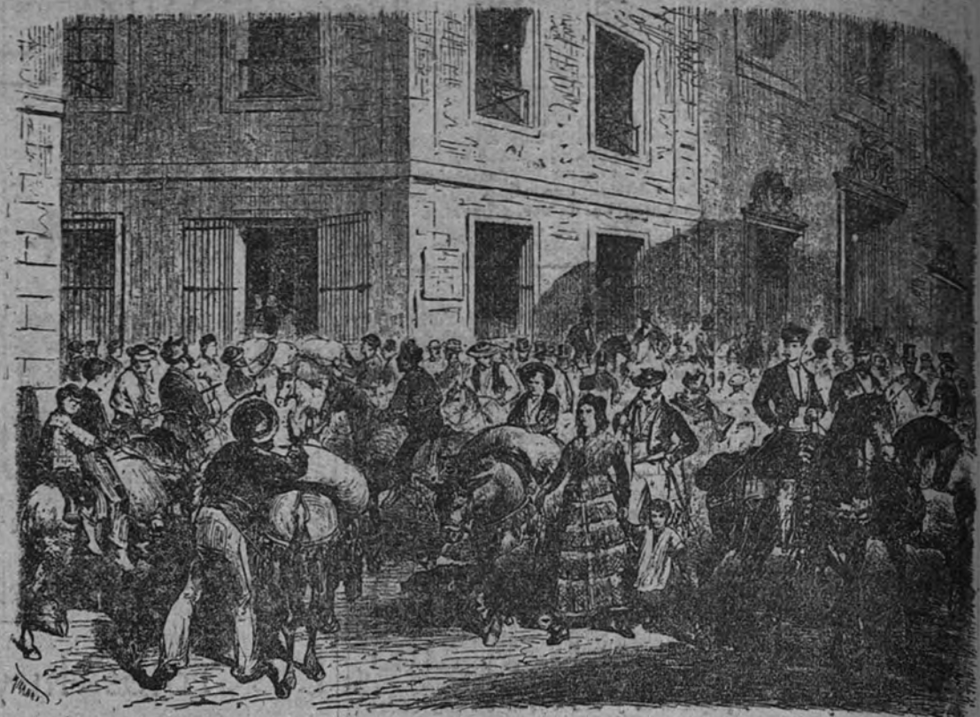
Aspecto de la calle de Hortaleza el día de San Antonio Abad. (Grabado de 1873)

El acto del sorteo es público y la asistencia de los reclutas voluntaria, debiendo los que asistan guardar el mayor orden.