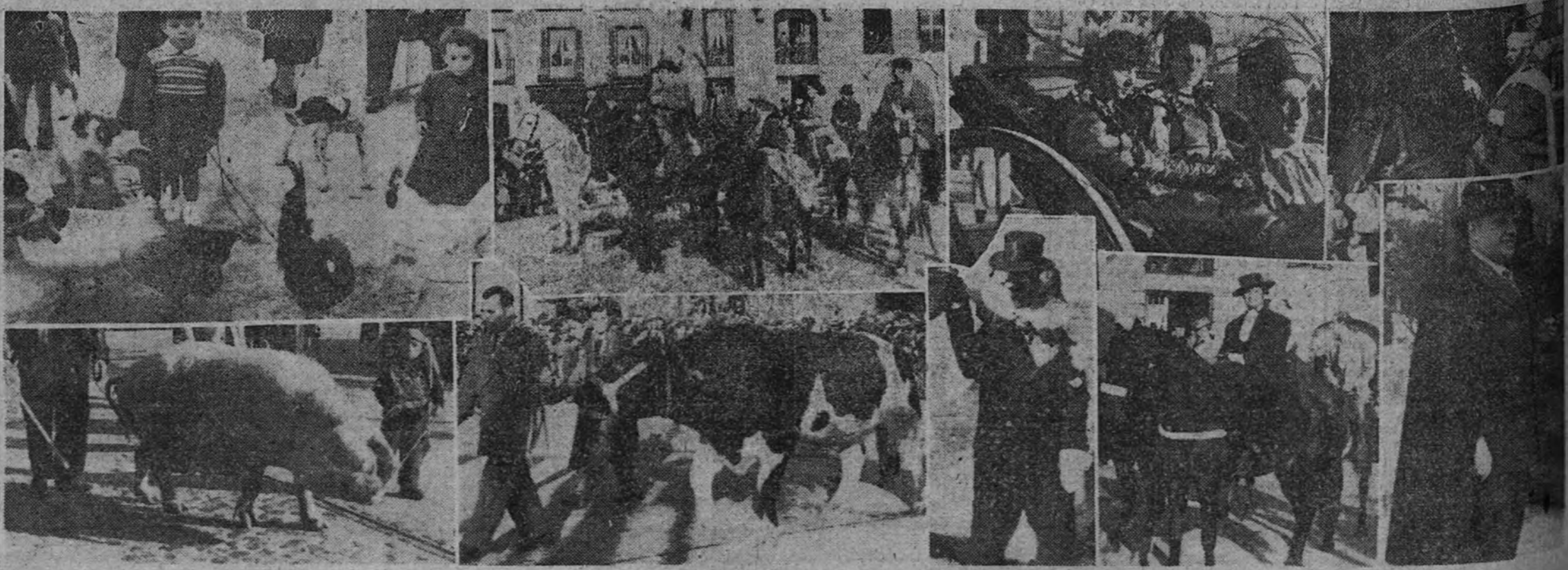
Avuntamiento de Madrid