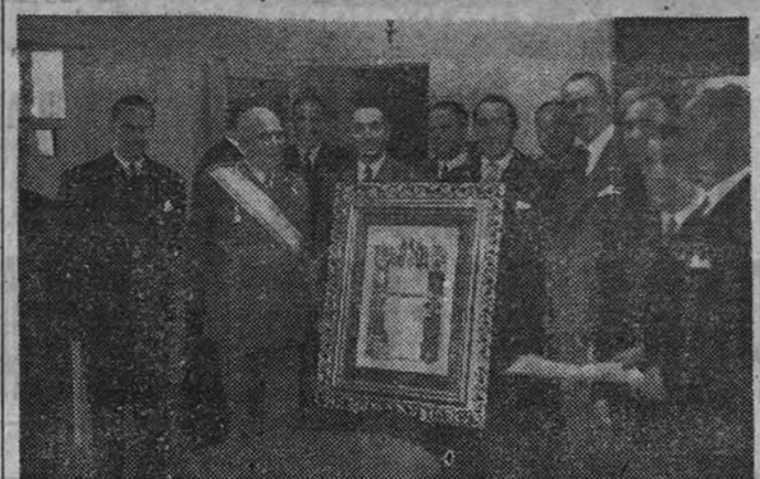
Una instantánea del acto celebrado en la Embajada argentina

Las autoridades de aquella ciudad le entregaron ayer el nombramiento