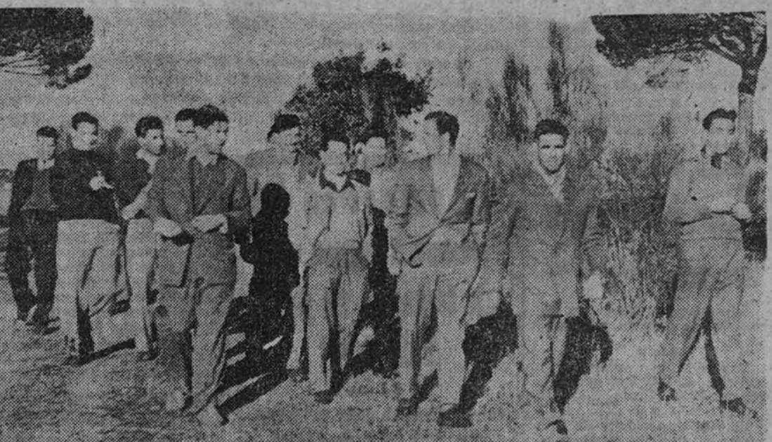
El Atlético y el Madrid han concentrado sus equipos en El Plantío y Aranjuez, respectivamente, de donde no regresarán hasta el mediodía de hoy. En la foto superior vemos un grupo de jugadores atléticos paseando por los pinares de El Plantío, y en la inferior, a varios componentes del conjunto madridista en uno de los rincones más bellos de Aranjuez.

Es... un Madrid-Atlético, en una palabra.