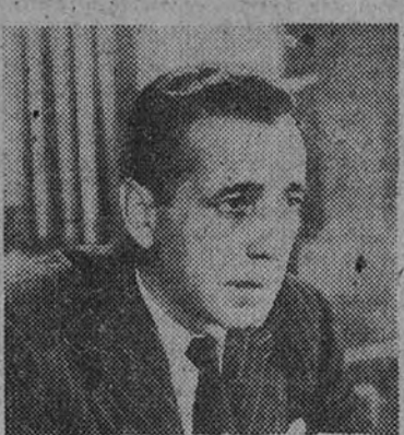
Humphrey Bogart emociona al público desde la pantalla del cine Avenida con la película Warner «La senda tenebrosa», de la que es protagonista. Este título entra mañana en su segunda semana de éxito.

Gary Cooper y Bárbara Stanwyck gozan de verdaderas legiones de admiradores entre el público de Madrid. Proyecciones y Palacio del Cine se verán, pues, concurridísimos de público ávido de admirar a sus artistas favoritos en esta insuperable película.