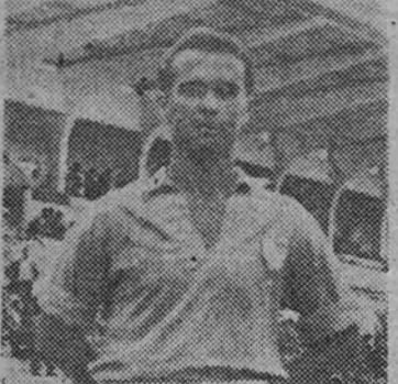
El Atlético de Madrid es uno de los clubes españoles que mayor predilección sienten por los jugadores canarios.

Vertical: 1. Reimpago. 2. Glosa. 3. Va. Ana. To. 4. Estreñis. 5. Agria. 6. Astar. 8. Reama. 9. Agria. 10. Revestir. 2. Aso. 3. La. Trazar. 4. Aparte. M. 5. La. Trazar. 6. Diano. 7. A. 8. La. Trazar. 9. Diano. 10. Opusculos.