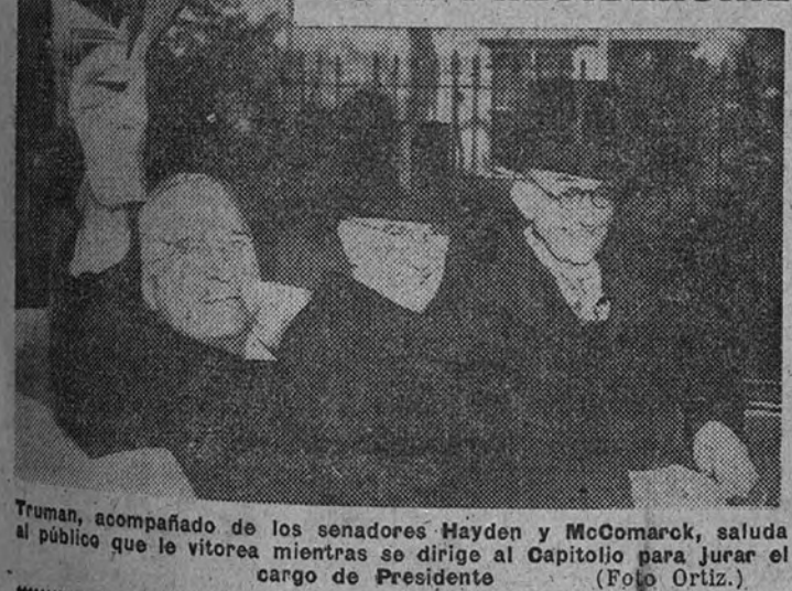
Truman, acompañado de los senadores Hayden y McComack, saluda al público que le vitorea mientras se dirige al Capitolio para jurar el cargo de Presidente.