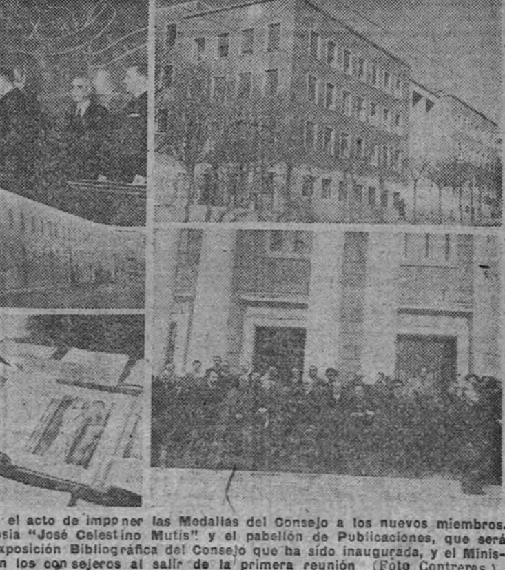
El Ministro de Educación Nacional en el acto de imponer las Medallas del Consejo a los nuevos miembros. Vistas de los edificios de Farmacología “José Celestino Mutis” y el pabellón de Publicaciones, que será inaugurado el próximo sábado. La Exposición Bibliográfica del Consejo que ha sido inaugurada, y el Ministerio de Educación Nacional con los consejeros al salir de la primera reunión.