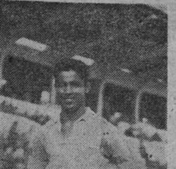
El Atlético de Madrid es uno de los clubes españoles que mayor predilección sienten por los jugadores canarios.