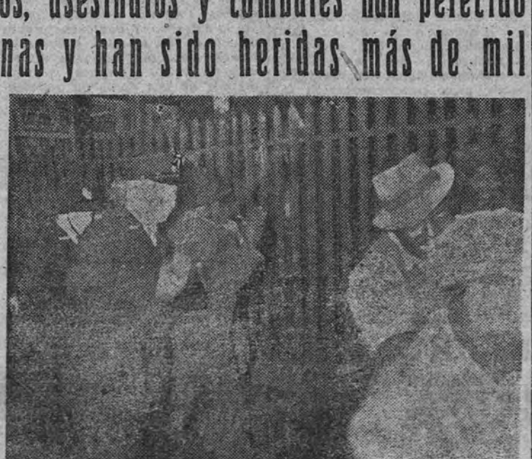
La Policía de Durban, armada de porras, ataca a los alborotadores negros durante los recientes disturbios

bernantes expertos en la técnica de “divide y reinarás”, o también, una vez comenzados, pueden ser deliberadamente intensificados por elementos ansiosos de pescar en aguas turbias.