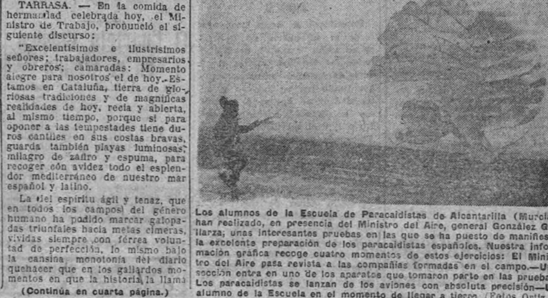
Los alumnos de la Escuela de Paracaidistas de Alcantarilla (Murcia) han realizado, en presencia del Ministro del Aire, general González Galland, unas interesantes pruebas en las que se ha puesto de manifiesto la excelente preparación de los paracaidistas españoles. Nuestra información gráfica recoge cuatro momentos de estos ejercicios: El ministro del Aire pasa revista a las compañías formadas en el campo.—Una sección entra en uno de los aparatos que tomaron parte en las pruebas. Los paracaidistas se lanzan de los aviones con absoluta precisión.—Un alumno de la Escuela en el momento de llegar a tierra.

TARRASA.—En la comida de hermandad celebrada hoy, el Ministro de Trabajo, pronunció el siguiente discurso: “Excelentísimos e Ilustrísimos señores: trabajadores, empresarios y obreros; camaradas: Momento alegre para nosotros el de hoy. Estamos en Cataluña, tierra de gloriosas tradiciones y de magníficas realidades de hoy, recta y abierta, al mismo tiempo, porque si para oponer a las tempestades tiene duras canchales en sus costas bravas, guarda también playas luminosas; milagro de zafiro y espuma, para recoger con avidez todo el esplendor mediterráneo de nuestro mar español y latino. La piel espíritu ágil y tenaz, que en todos los campos del género humano ha podido marcar gloriosas triunfales hacia metas cimeras, vividas siempre con férrea voluntad de perfección, lo mismo bajo la cansina monotonía del diario que en los en los galardos momentos en que la historia llama (Continúa en cuarta página.)