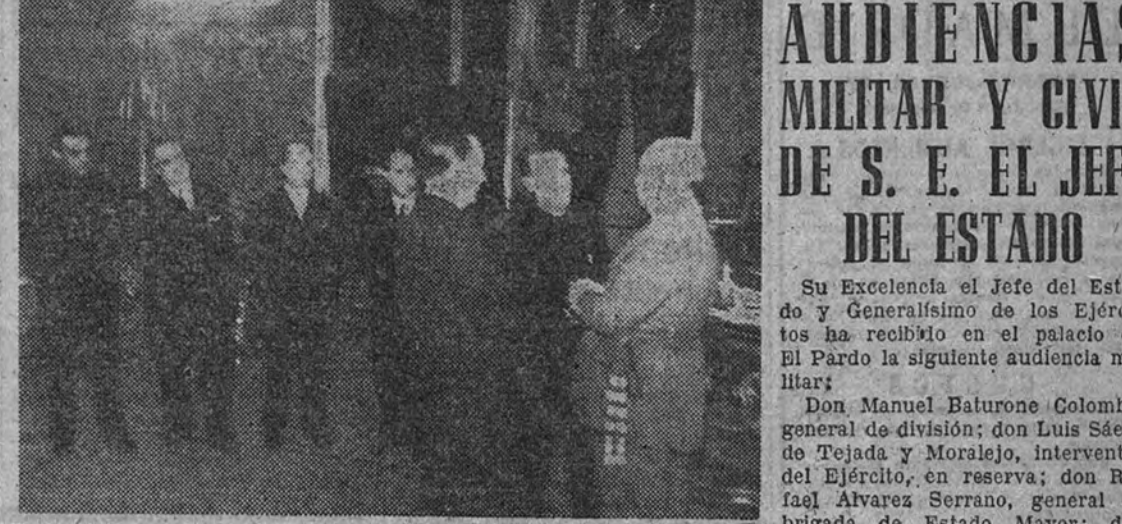
El Caudillo con la representación del Ayuntamiento de Alcoiciras y con la Comisión Permanente del Consejo Económico Sindical, presidida por el Ministro Secretario General, a quienes recibió en audiencia ayer