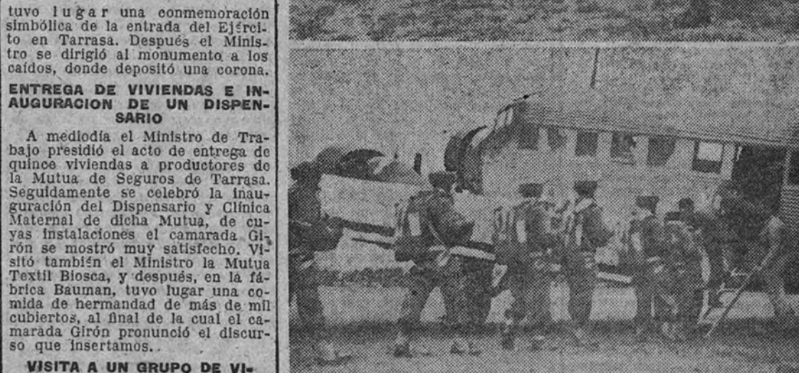
Los alumnos de la Escuela de Paracaidistas de Alcantarilla (Murcia) han realizado, en presencia del Ministro del Aire, general González Galland, unas interesantes pruebas en las que se ha puesto de manifiesto la excelente preparación de los paracaidistas españoles. Nuestra información gráfica recoge cuatro momentos de estos ejercicios: El ministro del Aire pasa revista a las compañías formadas en el campo.—Una sección entra en uno de los aparatos que tomaron parte en las pruebas. Los paracaidistas se lanzan de los aviones con absoluta precisión.—Un alumno de la Escuela en el momento de llegar a tierra.

Por la tarde el camarada Girón visitó un grupo de 200 viviendas económicas que se están construyendo por diversas Empresas textiles para sus productores y fué informado de un proyecto para la total solución del problema de la vivienda en Tarrasa.