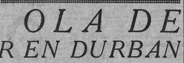
La Policía de Durban, armada de porras, ataca a los alborotadores negros durante los recientes disturbios

FUNCION RELIGIOSA Desde el Ayuntamiento, el Ministro, con las demás autoridades, se trasladó a la iglesia del Santo Espíritu, donde se celebró un solemne oficio, seguido de un tedum. Nuevamente en el Ayuntamiento.