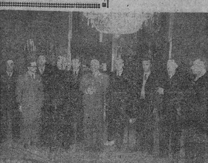
Su Excelencia el Jefe del Estado con una representación de la Cofradía de Pescadores de Carliño (La Coruña), a los que ha recibido en el palacio de El Pardo.