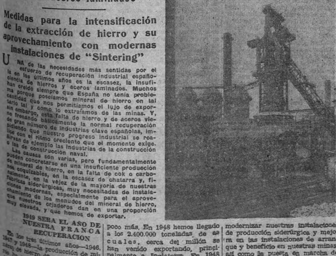
1949 SERA EL AÑO DE NUESTRA FRANCA RECUPERACION. En los tres últimos años—1946, 1947 y 1948—la producción de lingote de hierro de nuestros cruceros ha venido siendo igual: alrededor de 2.300.000 toneladas.

Medidas para la intensificación de la extracción de hierro y su aprovechamiento con modernas instalaciones de "Sintering"