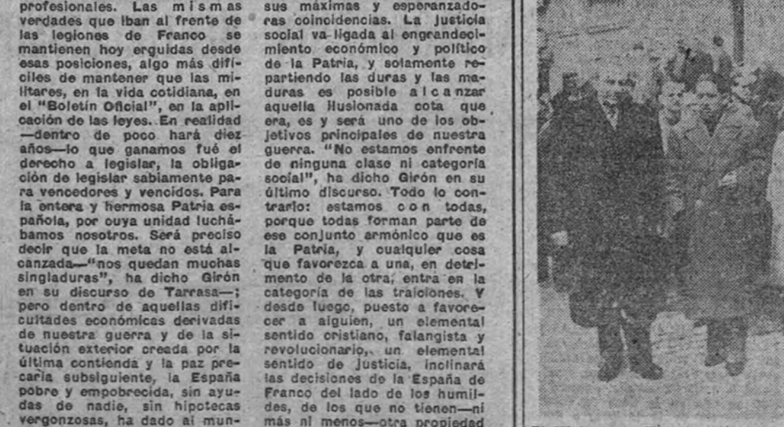
El Ministro de Trabajo, camarada José Antonio Girón, en compañía del Gobernador Civil y Jefe Provincial de Barcelona y otras autoridades, sale del Ayuntamiento para dirigirse al Monumento a los Caídos, donde depositó una corona.