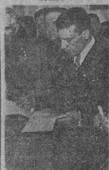
El ministro portugués del Ejército, general Fernando Santos, leyendo su discurso a la guarnición después de haber recibido la adhesión de las fuerzas armadas del país, durante la visita en que le hicieron patente su disciplina.

Esta colección constituye el compendio de arte chino más valioso de todos los tiempos, según anuncia el director del Museo de Peking. (Efe.)