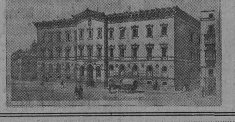
Buenos Aires. Enero 1949.

No se convierte en atmósfera de la urbe el aire que viene por la de Hortaleza, como si ese mayor apartamiento del sociológico viejo de la ciudad universitaria