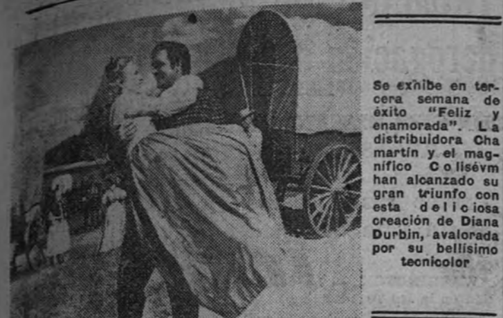
Se exhibe en tercera semana de éxito "Feliz y enamorada". La distribuidora Oha Martin y el magnífico O'Hara han alcanzado su gran triunfo con esta delicia de creación de Diana Durbin, avalada por su bellísimo tecnicolor.