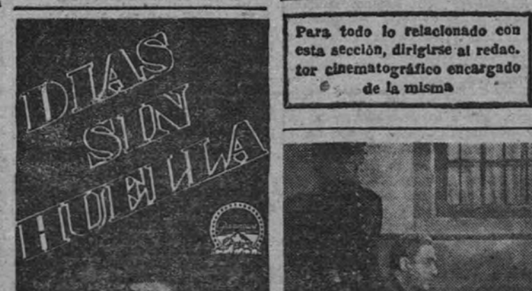
Horas de inconsciencia y angustia mortales para el recordado "Días sin huella". Esta gran producción Paramount distribuida por Mercurio Films admirará al público por su dramatismo e impresionante tema y por la labor de Ray Milland, labor que fue premiada con el Oscar de la Academia de Hollywood

Para todo lo relacionado con esta sección, dirigirse al redactor cinematográfico encargado de la misma