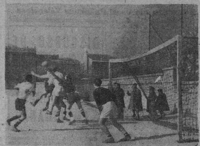
En el partido de fútbol celebrado por la mañana entre los equipos de las películas de Valencia Films "Neutralidad" y "Entre Barracas" se prodigaron jugadas tan emocionantes como la que recoge esta foto

rector general de Valencia Films, en nombre de esta ya prestigiosa empresa, obsequió con un almuerzo a los periodistas cinematográficos, a los ar-