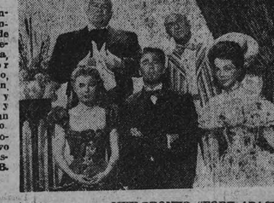
El Palacio de la Música cambia su programa mañana para estrenar la divertida comedia "Dos hermanas de Boston". Son sus intérpretes Kathryn Grayson, June Allyson, Lauritz Melchior y Jimmy Durante.

ANN BLYTH, COMPANERA DE CHARLES BOYER EN "VENGANZA DE MUJER" Ann Blyth, la inolvidable hija de Joan Crawford en "El sacrificio de una madre", protagoniza con Charles Boyer la cinta "Venganza de mujer", producida y dirigida por la Universal International.