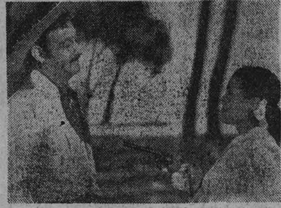
En el Real Cinema prosigue el éxito de la producción hispano-mexicana "Jalisco canta en Sevilla", que distribuye Chamartín y que interpreta como protagonista el popular actor Jorge Negrete, con Carmen Sevilla y "Chico" el gracioso actor mejicano.