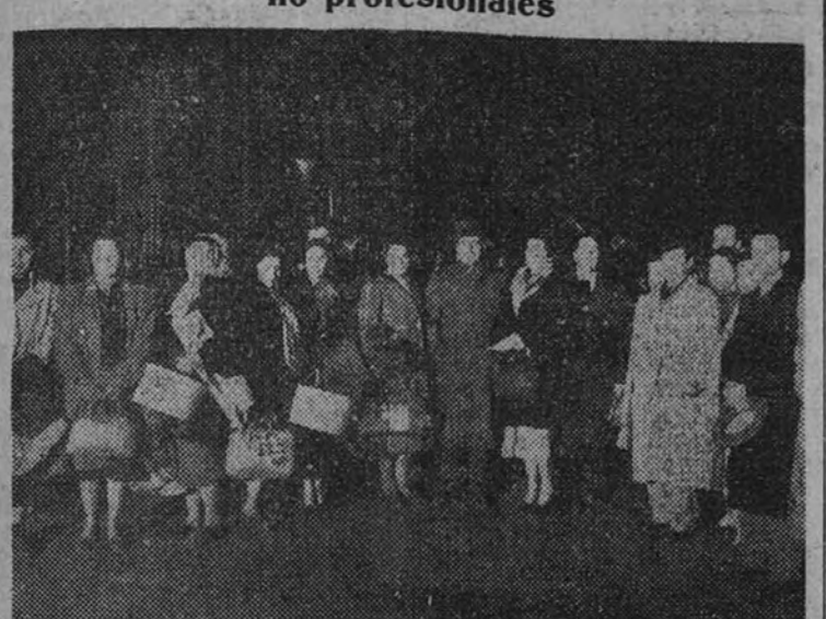
La Misión Cultural Artística del Perú, a su llegada a Madrid.

Está integrada por treinta y ocho artistas no profesionales