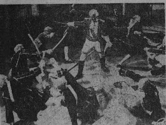
He aquí una prueba del dinamismo de "Jaque al Rey", el gran film de aventuras que Luis, S.A., y Conlisa estrenarán mañana lunes en el cine Imperial. La película relata las asombrosas hazañas del teniente Rehuse, cuya espada salvó a Suecia de la ambición de Rusia.