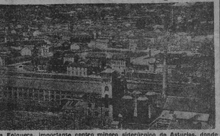
La Felguera, importante centro siderúrgico de Asturias, donde va a ser inaugurada la nueva fábrica de productos químicos

El Metro de Barcelona será prolongado, con un gasto de cincuenta millones de pesetas