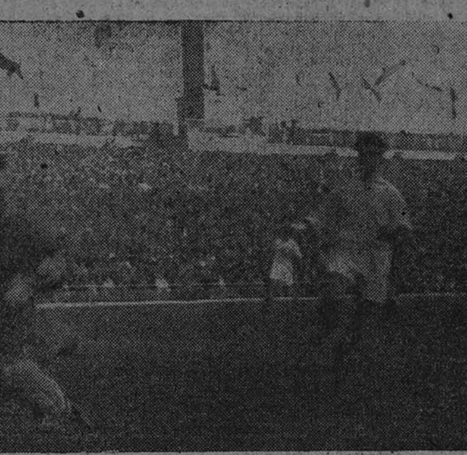
La seguridad que durante los noventa minutos demostró tener el portero del Sevilla queda reflejada en esta espectacular parada a un fortísimo tiro del madrileño Marcat.