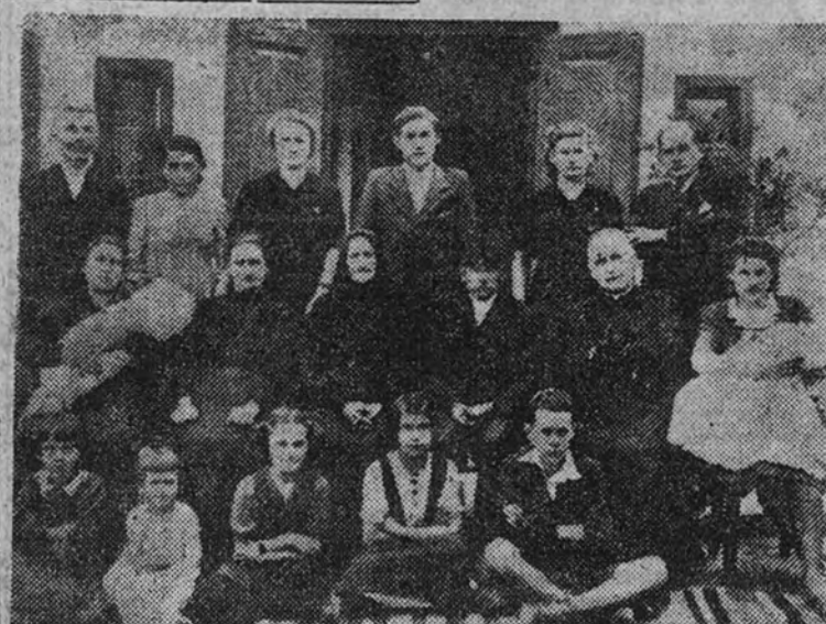
Esta es la familia del cardenal Mindszenty. El padre y la madre están sentados a la derecha del Primado húngaro. Reproducidos esta fotografía del número especial que la revista "Time" ha dedicado al proceso y condena del cardenal Mindszenty